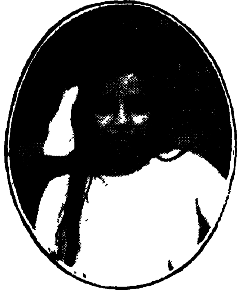
কুমারী অরুণা ( ক্লগ ) ( পৃ: ১৬৬ )