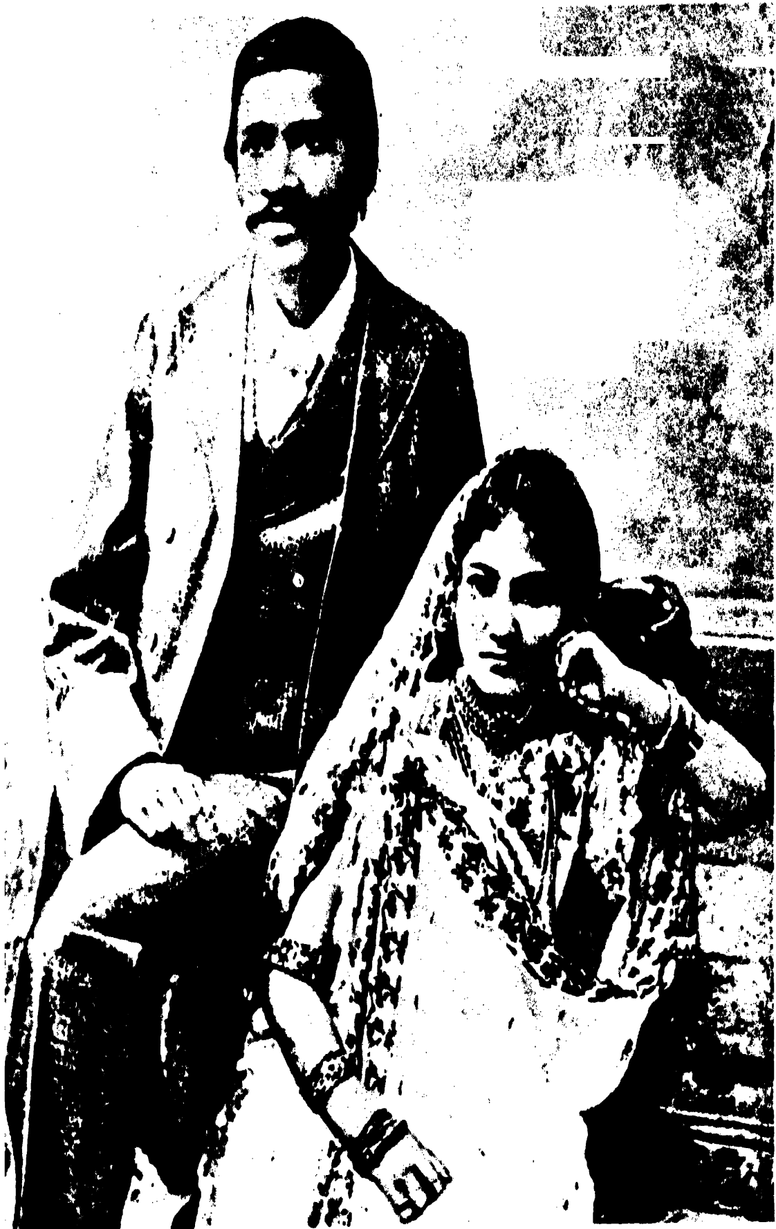
Sri Aurobindo with his wife Mrinalini Devi - 1901