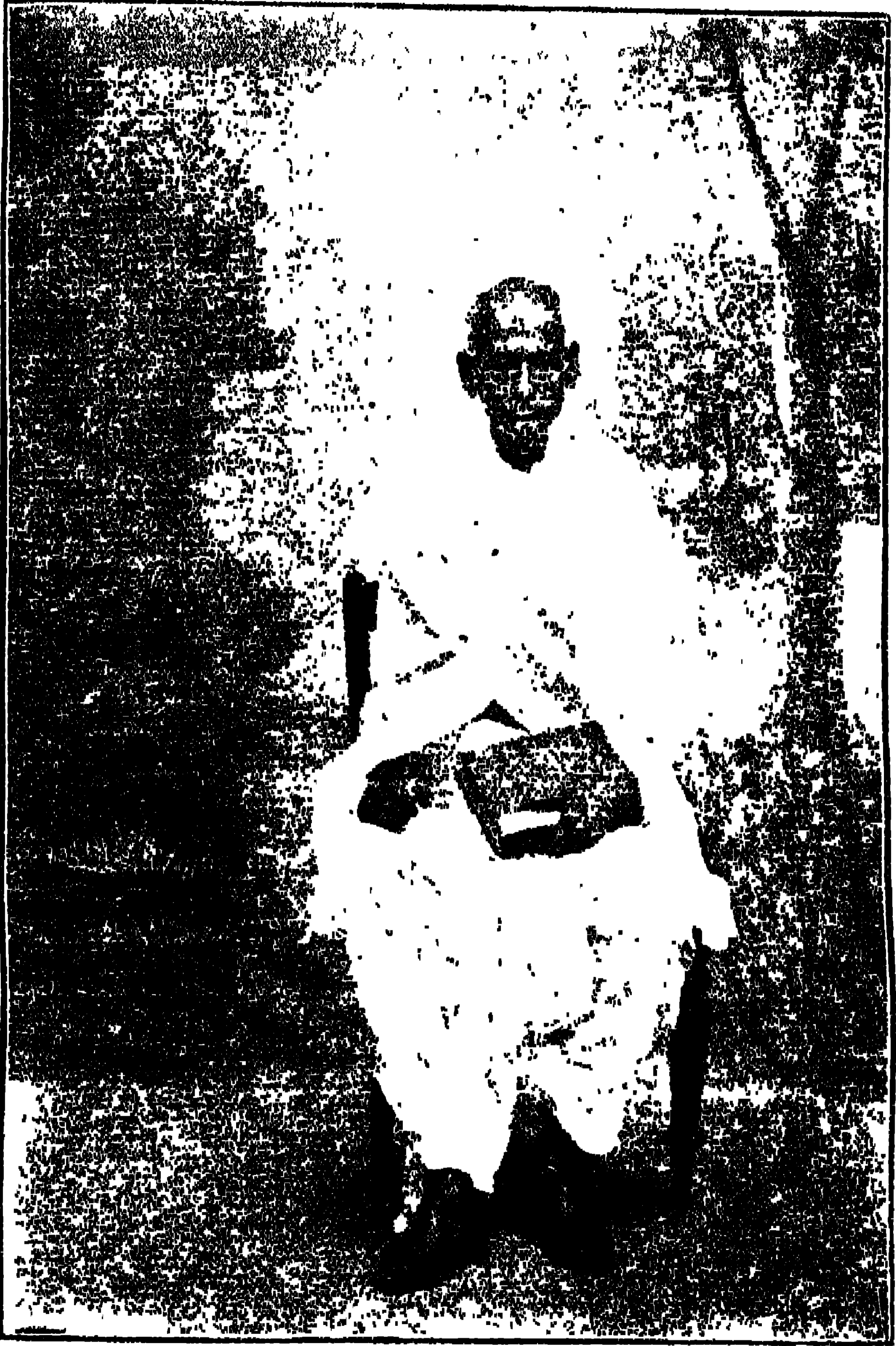
৩ রামসর্কস্ব বিদ্যাভিষণ