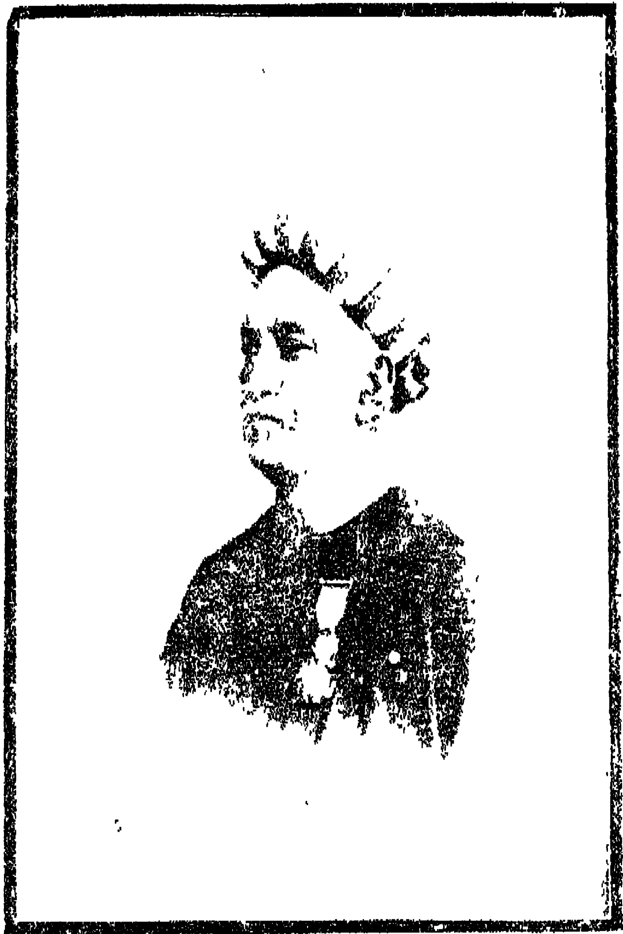
রাজা রাজেন্দ্রলাল মিত্র