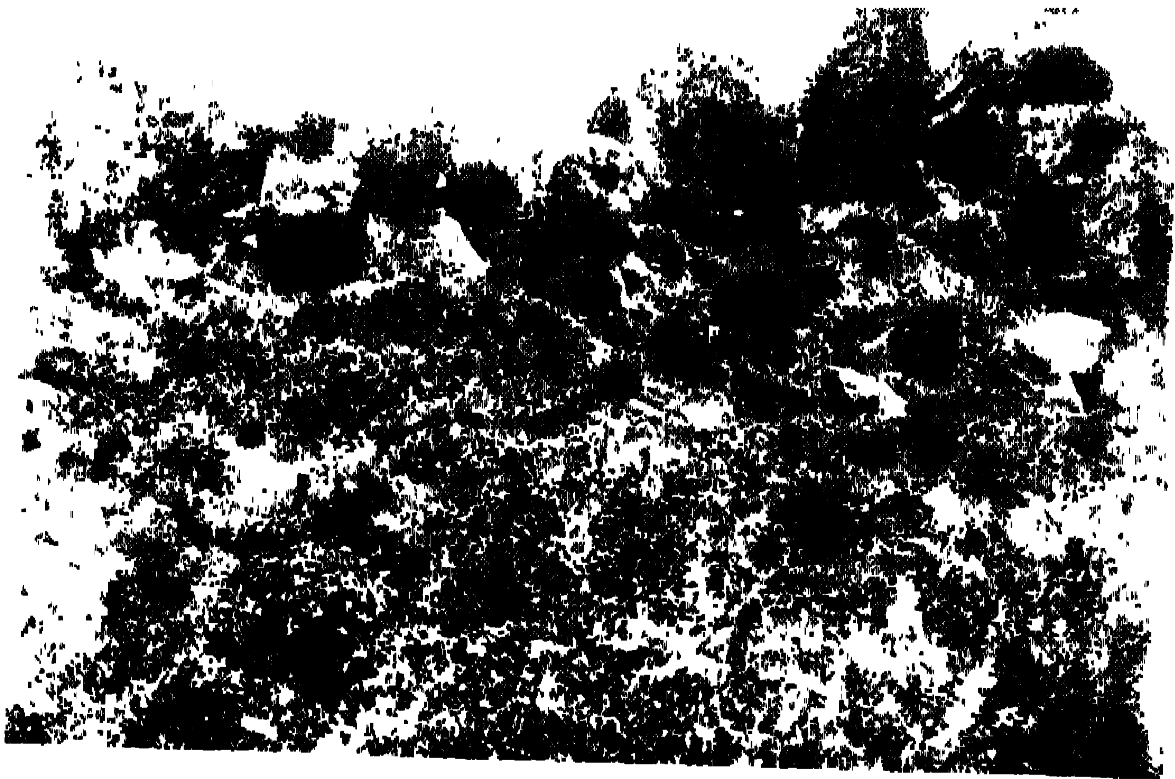
Gridhrakuta caves at Rajgraha. Taken from the hill opposite (Dark spots are cave mouths)

গ্ৰিড্ৰাকুটা গুহা রাজগ্রহে । বিপবাহু পাশস্থ পাচ্ছাদিত কঠোর শৃঙ্গের উপস্থিত ।