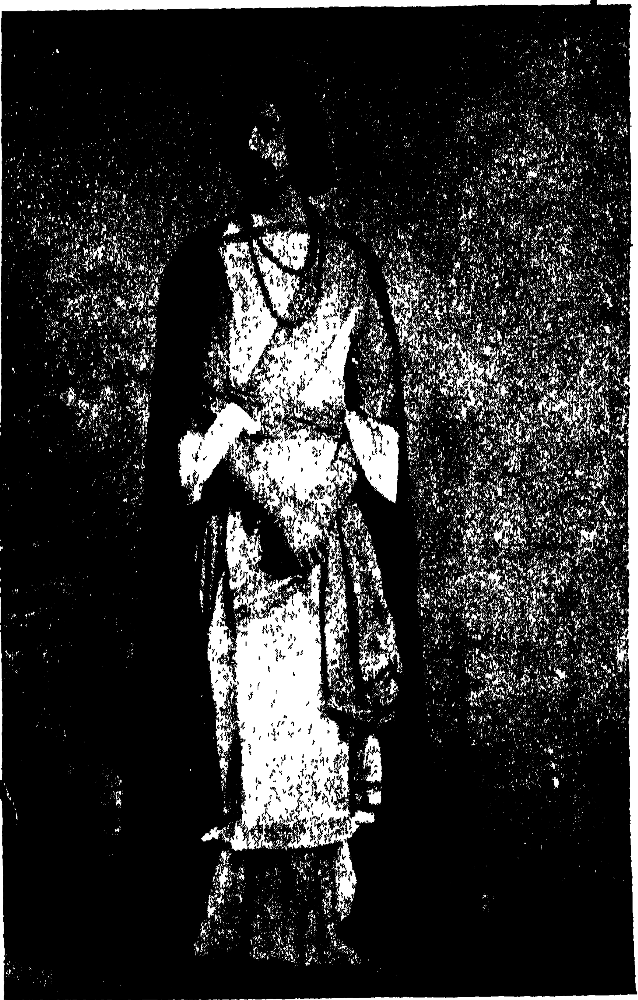
রবীন্দ্রনাথ . প্রথম 'বাল্মীকি-প্রতিভা' অভিনয়ে—বয়স ২০ বৎসর