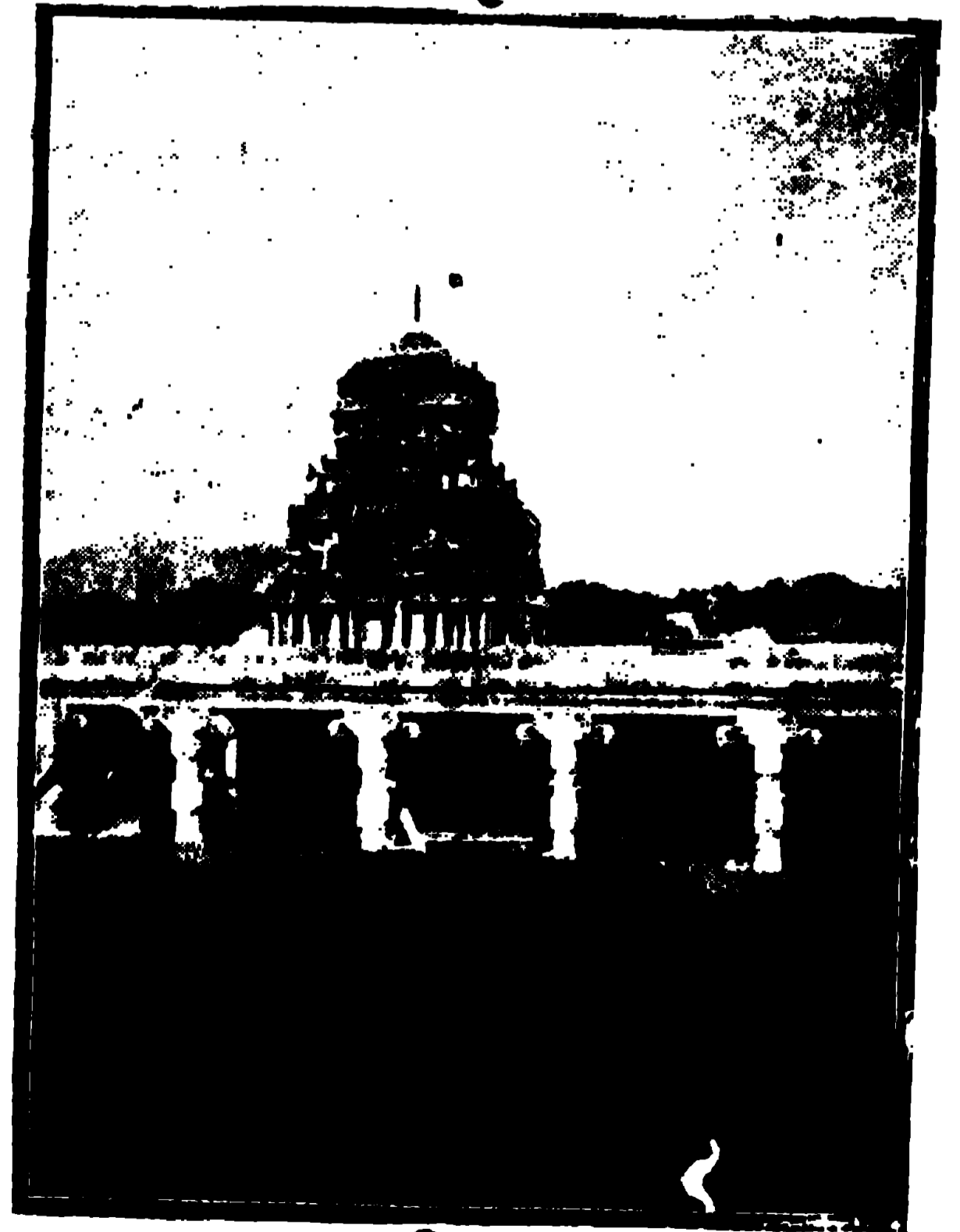
পেচিনয়কি অশ্বল মন্দির