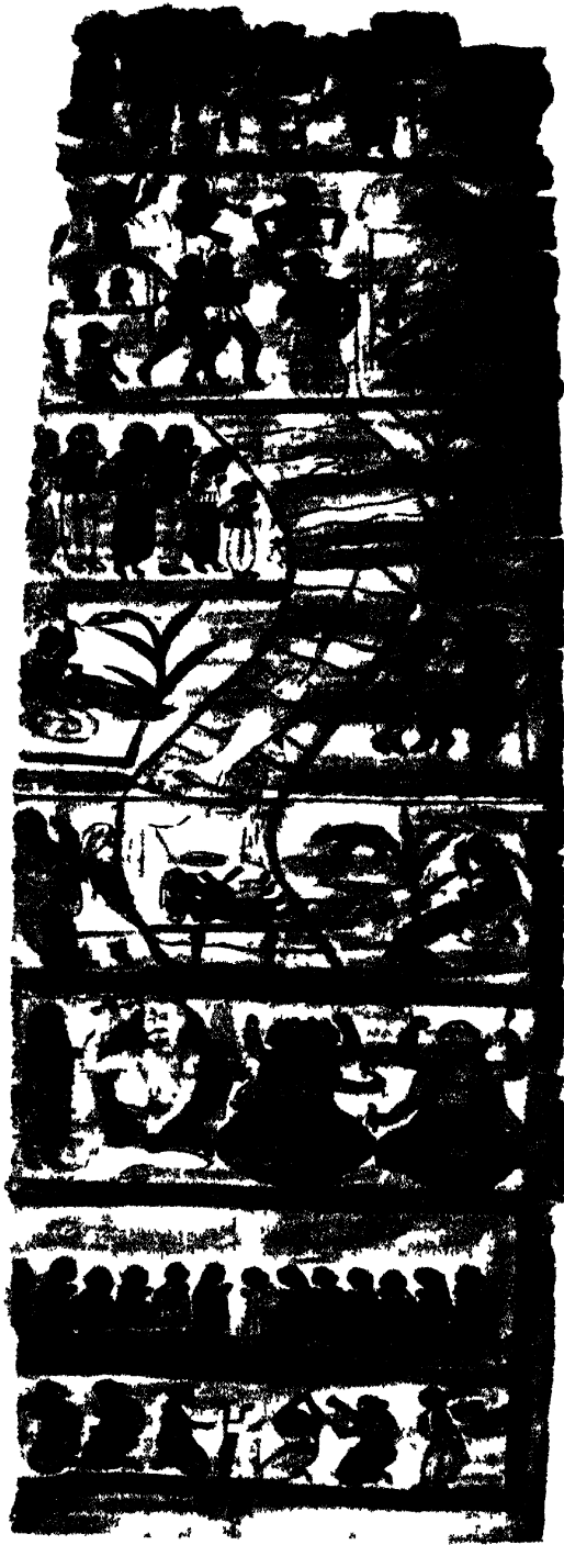
মনসা মঙ্গলেব পাট ( মদিনাবুবে পাণ্ড ) খ্রীস্ট ১২শ শতাব্দী