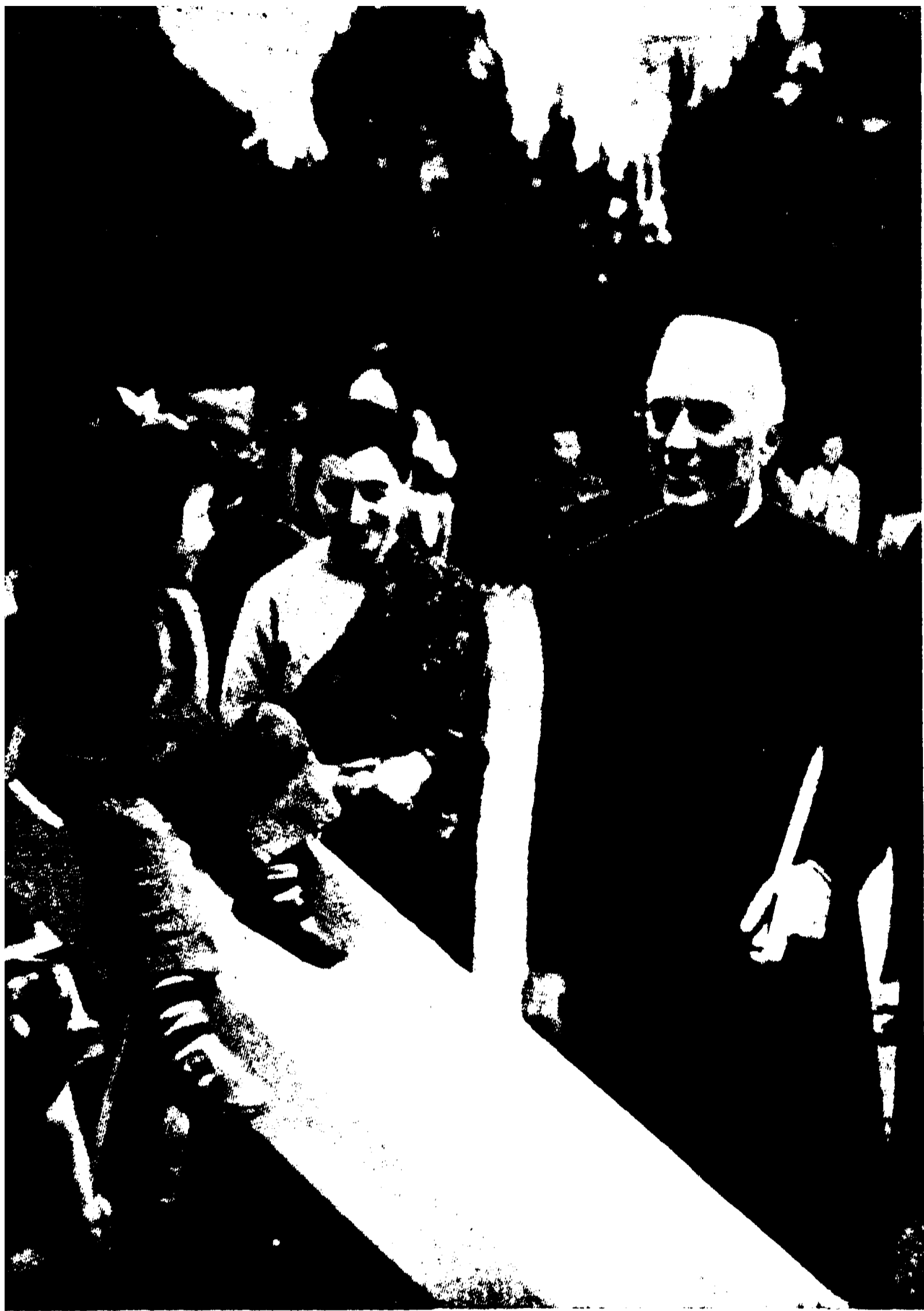
প্রধানমন্ত্রী ইন্নেভেল ও তাঁর কলা ইমর্টাল আর্করা পাকিস্টান কি গারগার্ডেন ইনস্টিটিউটে একটি চীনা বালককে সঙ্গে নিয়ে