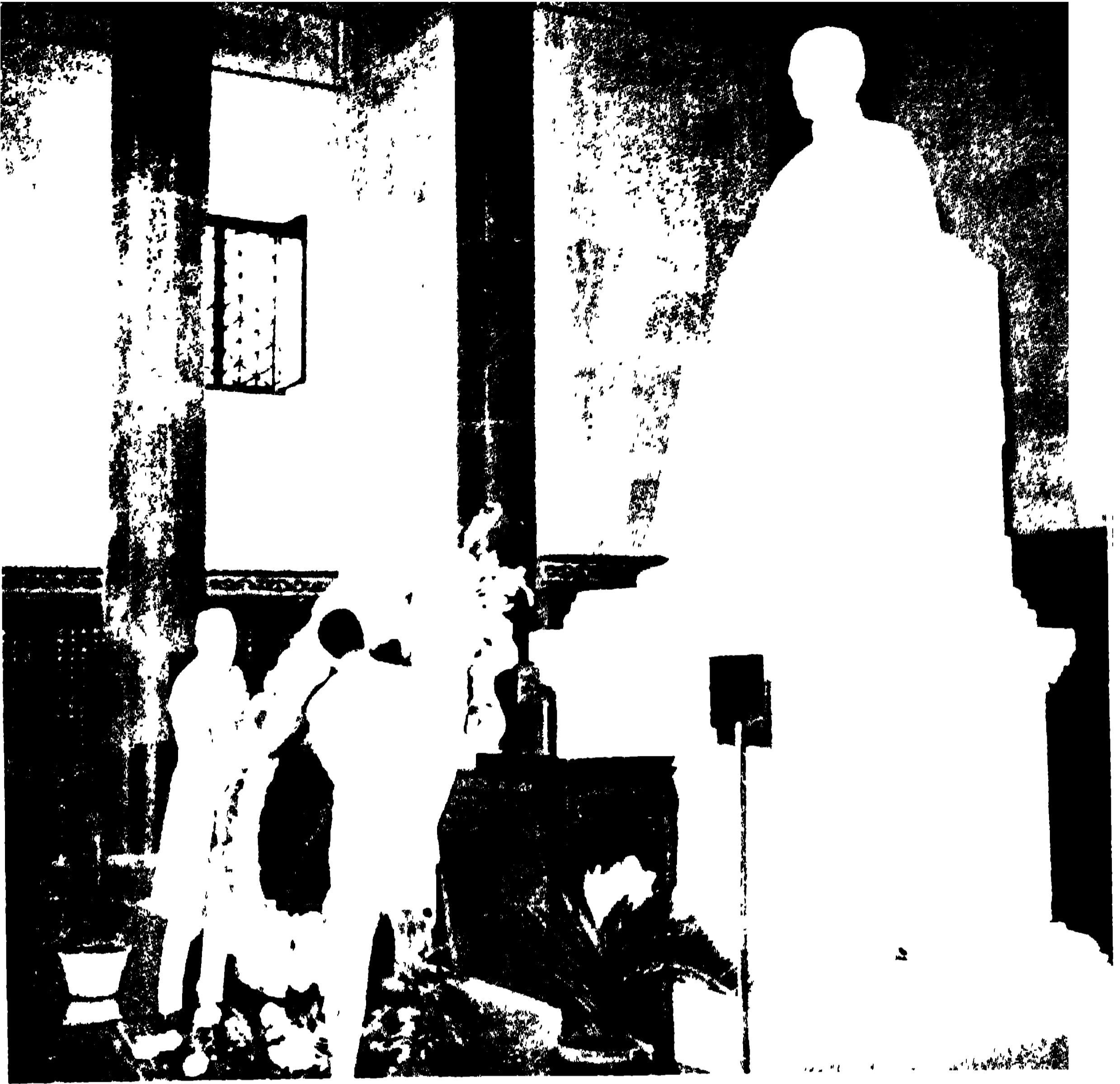
শ্রী মাদ্রাসা কলেজের ছাত্রদের দ্বারা স্মৃতিস্তম্ভটির উদ্বোধনী অনুষ্ঠানের কার্যক্রম। ১৯৫৬ খ্রিঃ, ১৯৫৬ খ্রিঃ