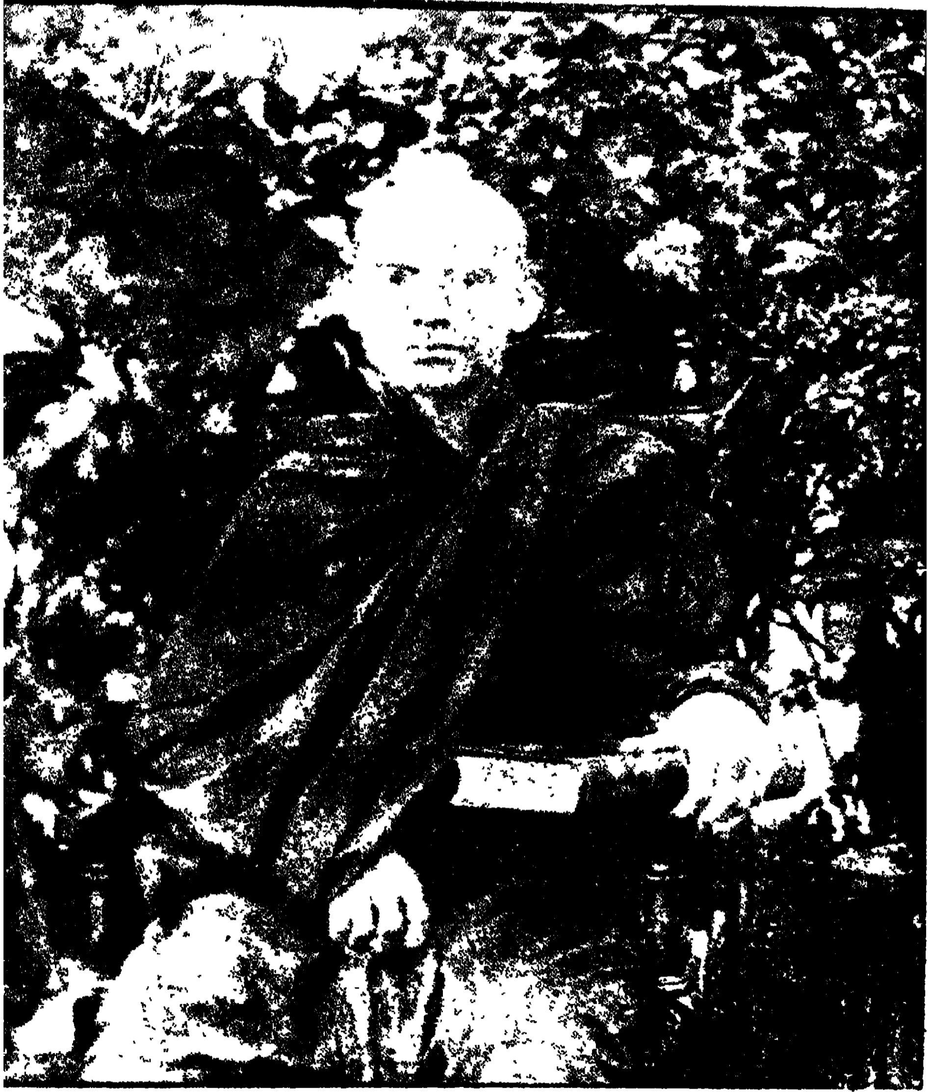
চট্টগ্রাম দক্ষিণ ছিলনিয়া নিবাসী পাচিন্দ্য সঙ্কলয়িতা শ্রীমৎ জিনবংশ স্ববির