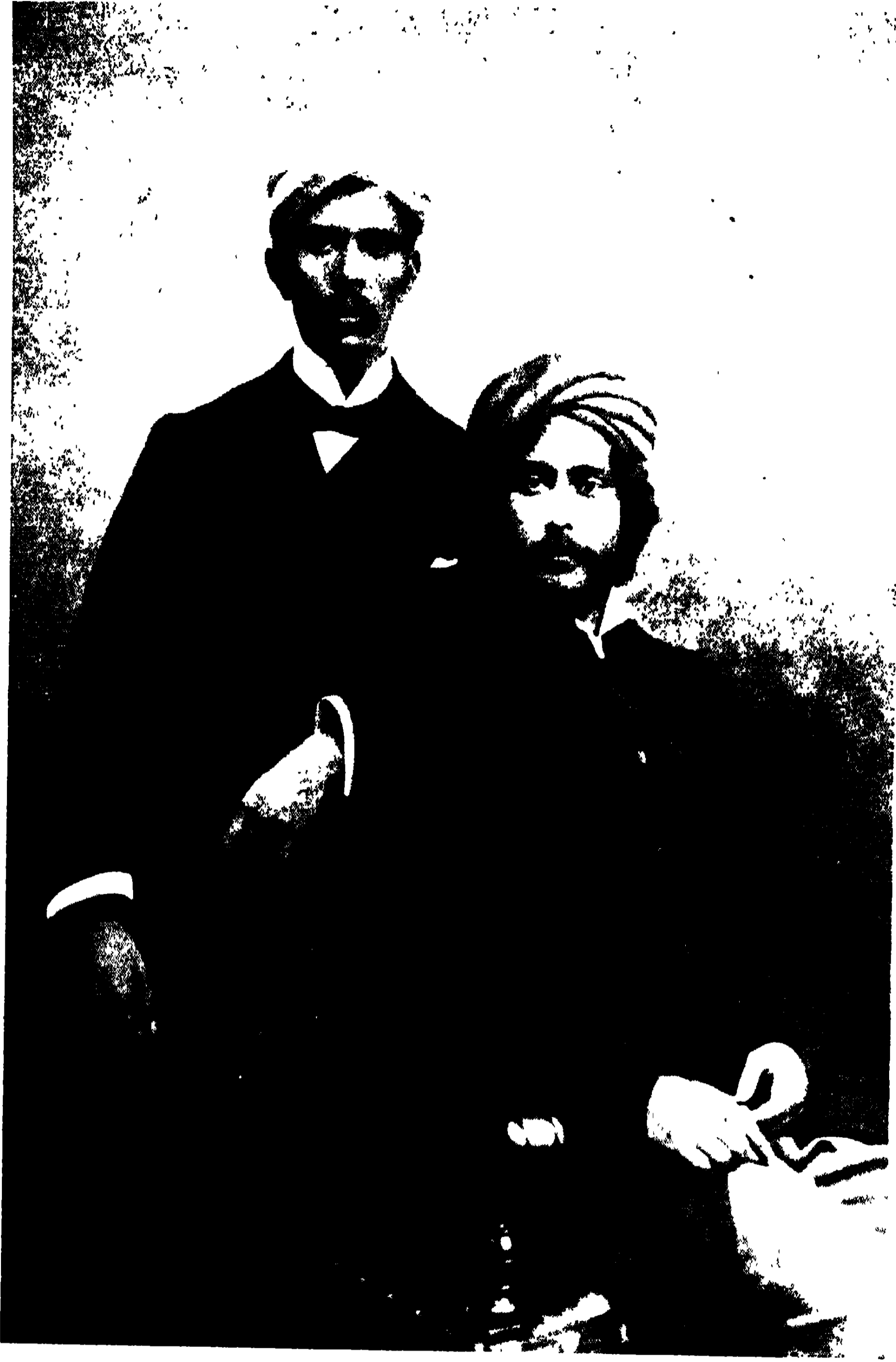
লোকেন্দ্রনাথ পালিত ও রবীন্দ্রনাথ