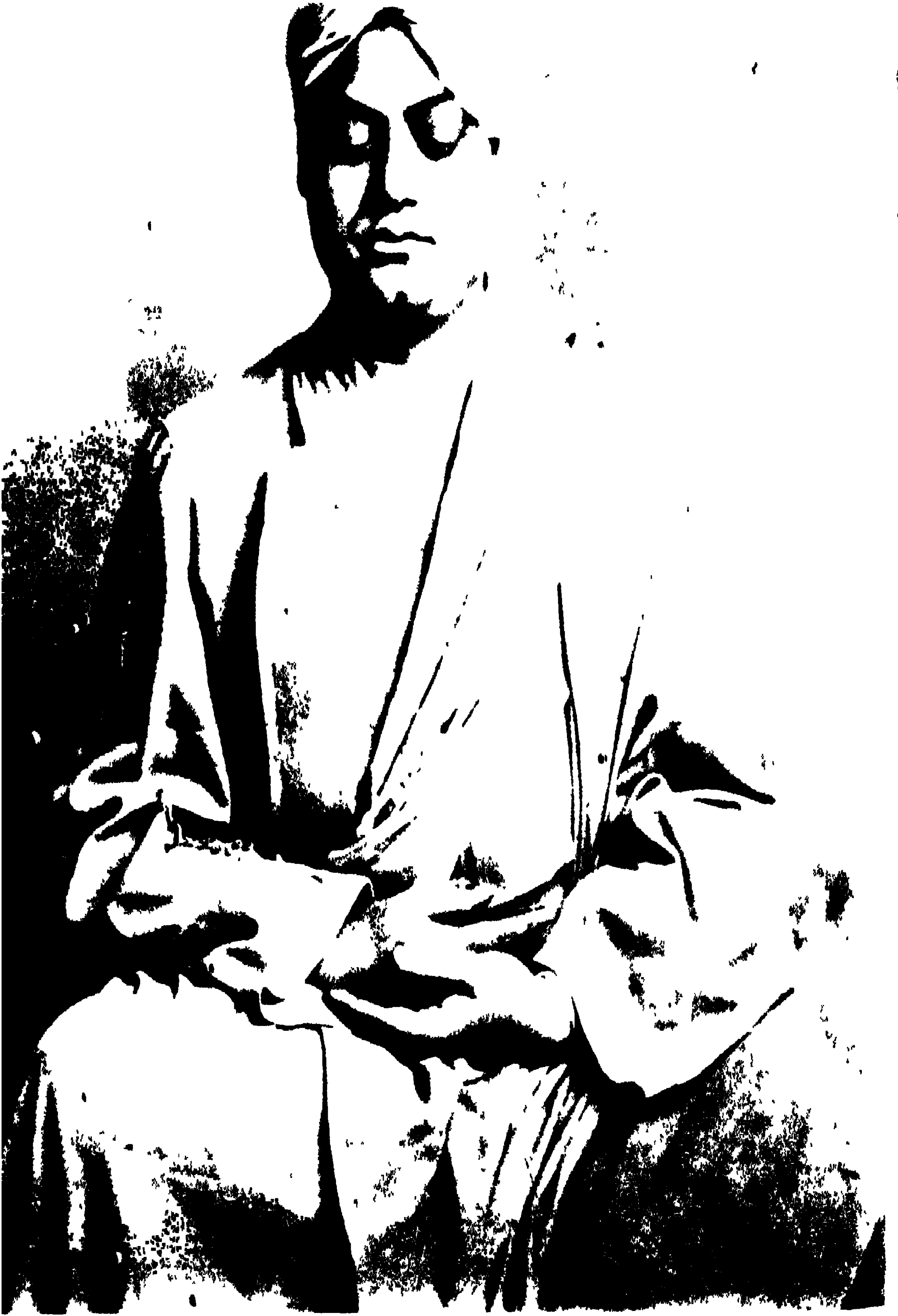
আচার্য্য শ্রীমৎ স্বামী বিবেকানন্দ