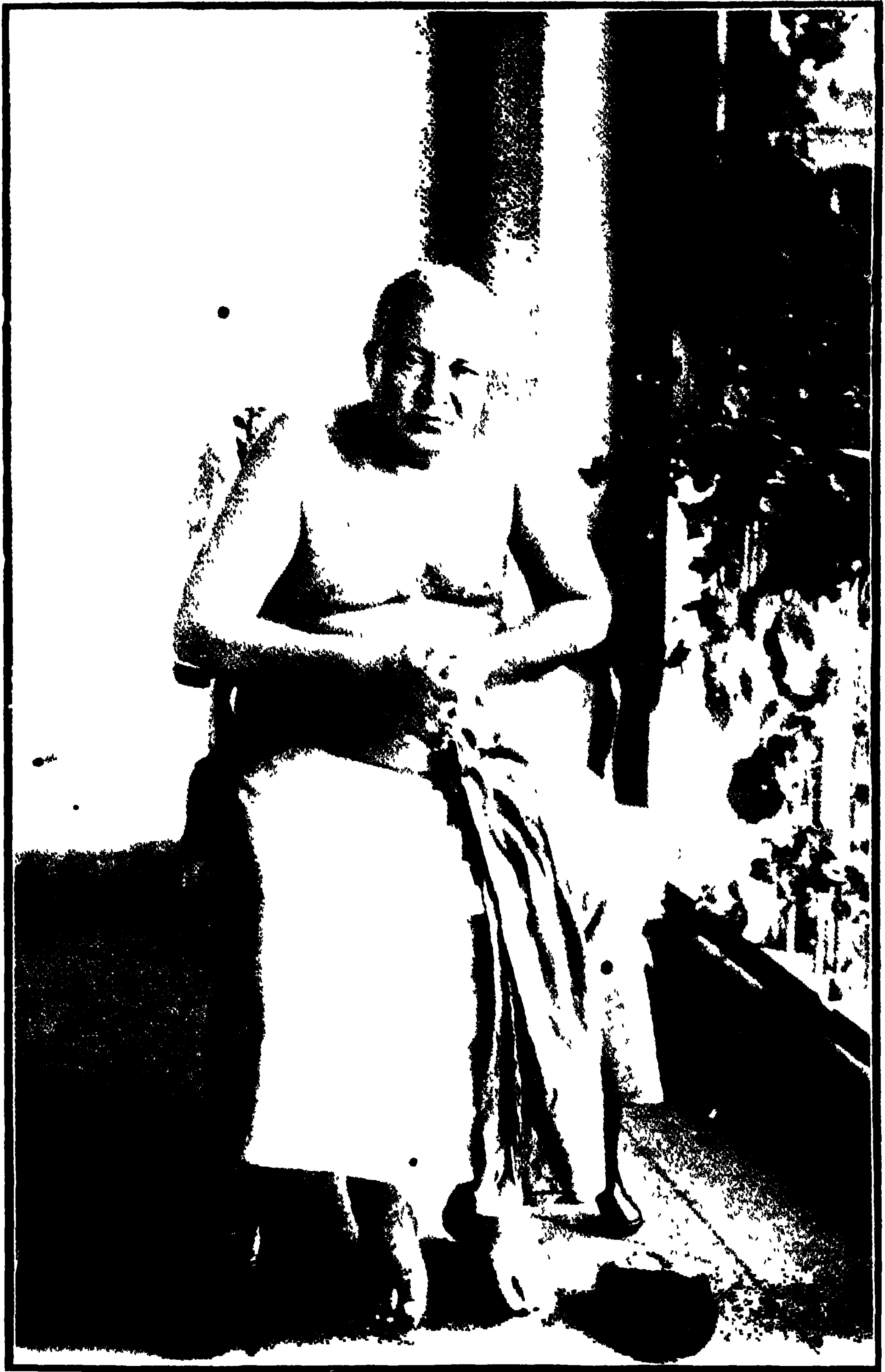
শ্রীমৎ স্বামী শিবানন্দ মহারাজ