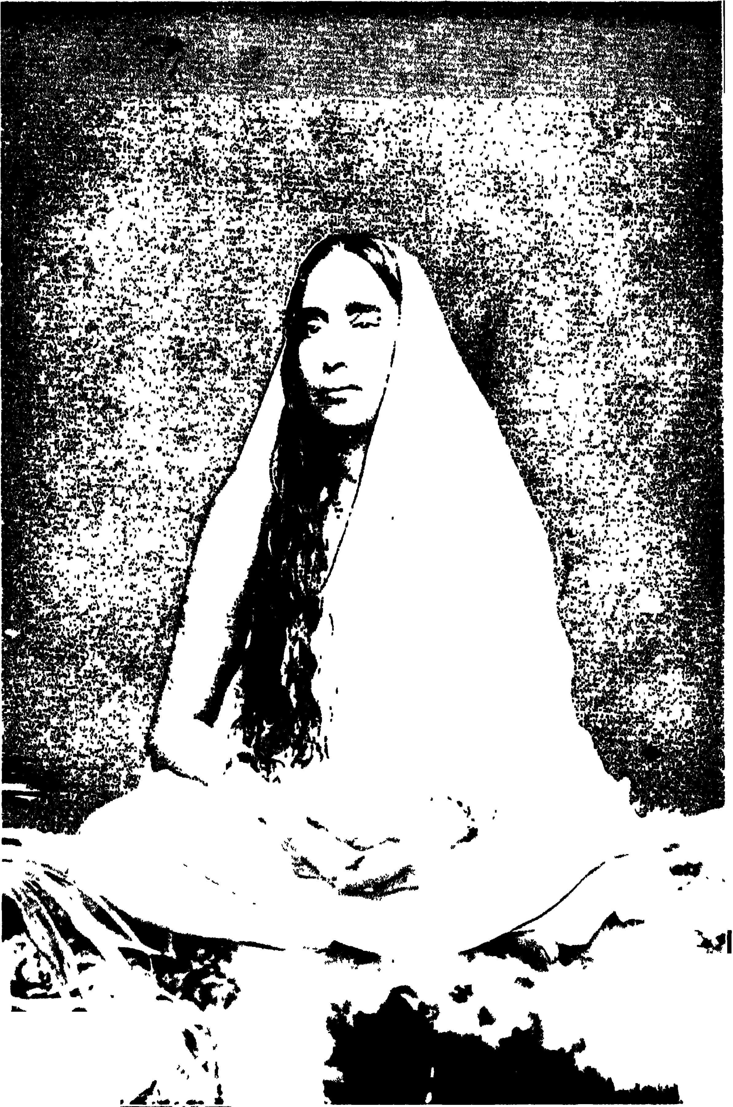
শ্রী শ্রীসারদেশ্বরী দেবী