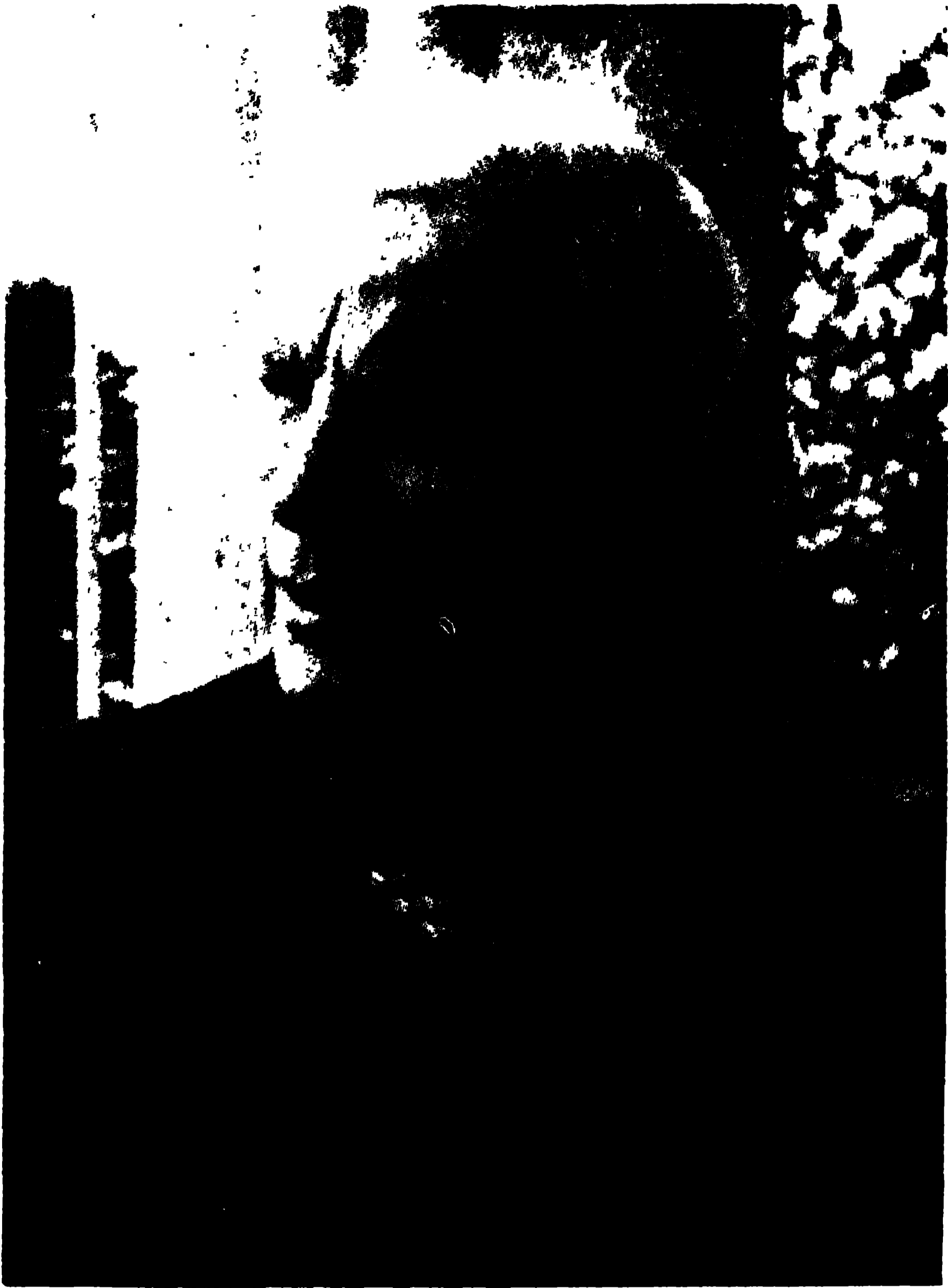
উনার ক্যামেরায় আমি