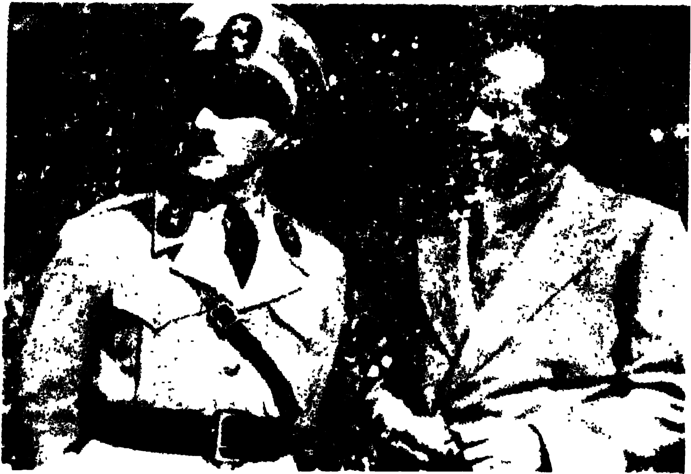
ডগলাস ফেরাব্যাক্সের সঙ্গে শেষ দেখা