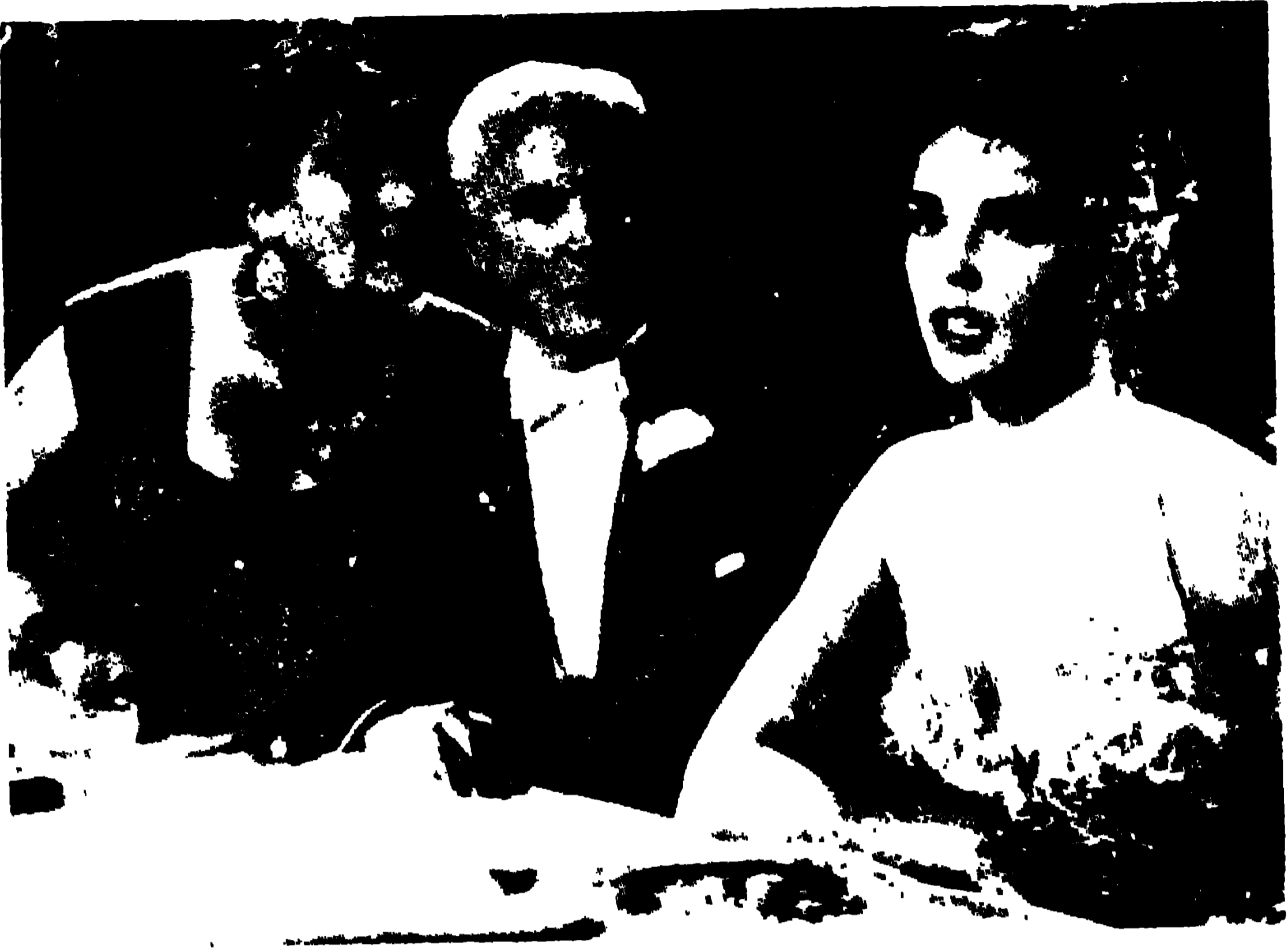
লণ্ডনে বেতালা প্রথম চিত্র দি কিং ইন নিউ ইংলেণ্ডে ডন জাডাস