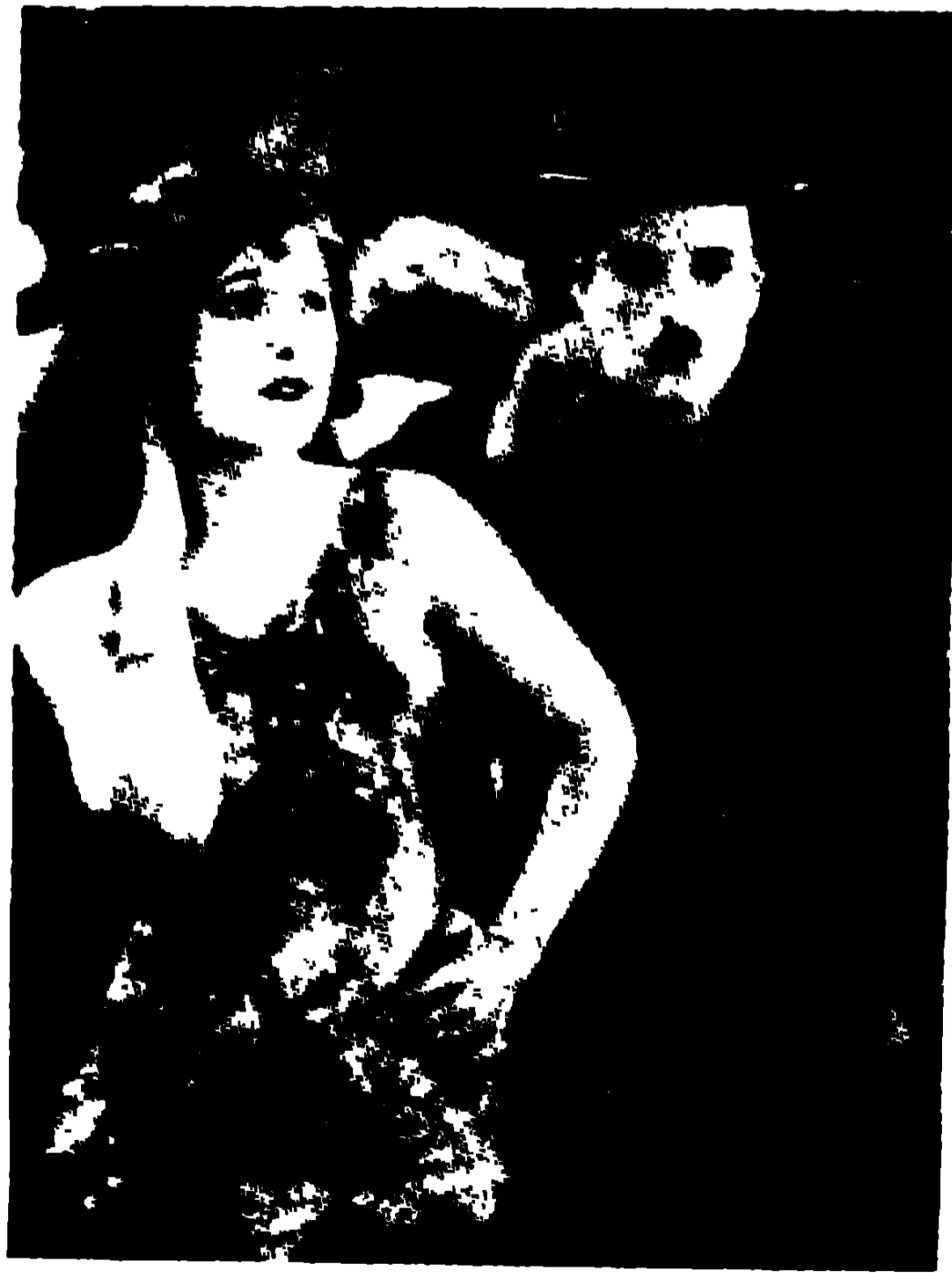
গোল্ডরাশে জঁজিয়া হেল