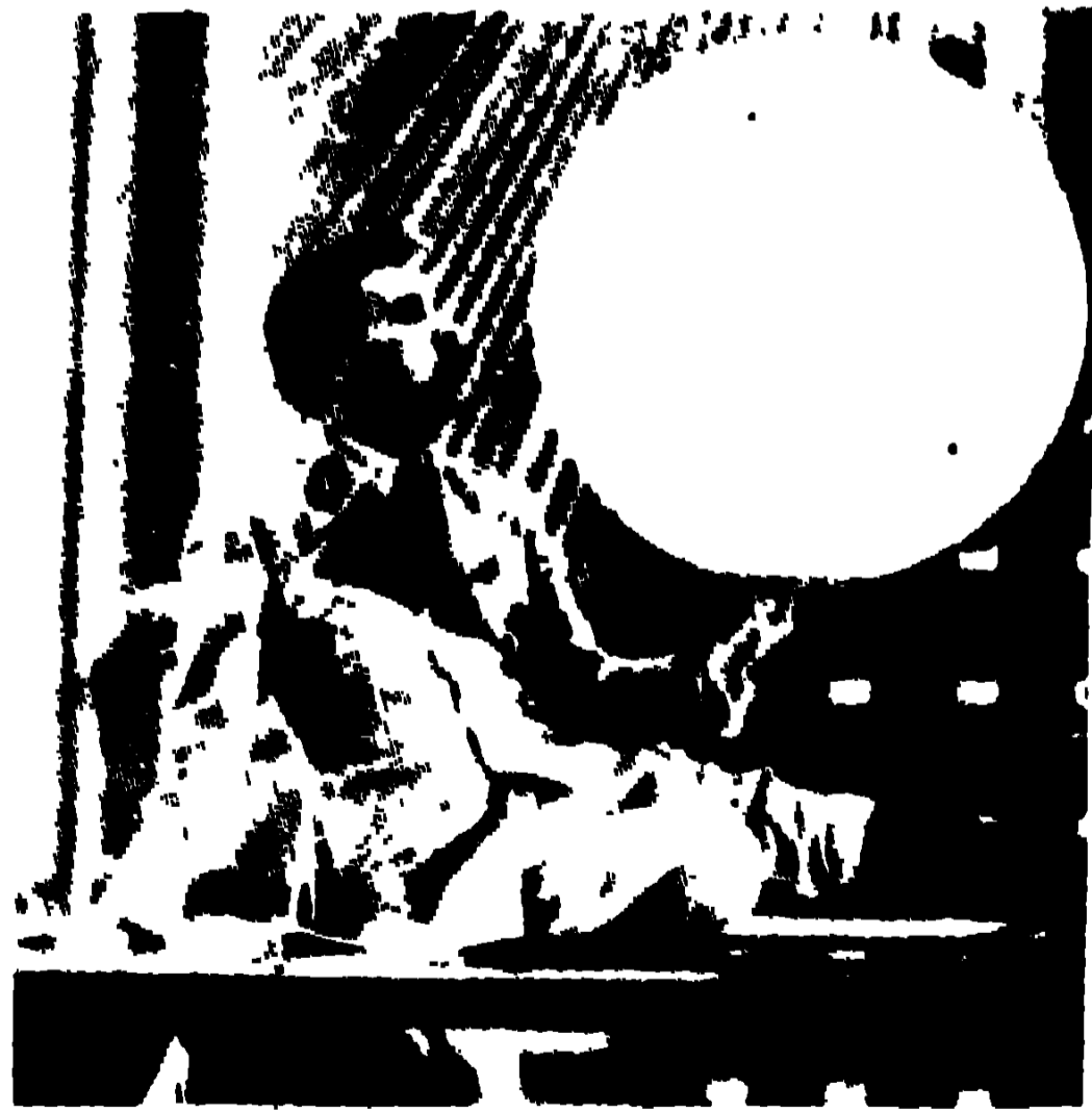
সেচ্ছাচারী গ্রেট ডিক্টেটর