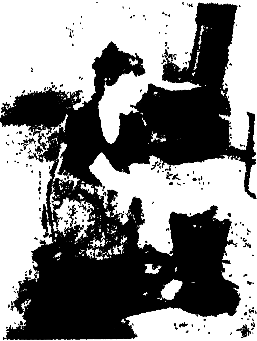
গ্রেট ডিক্টেটরে পলেট গদার