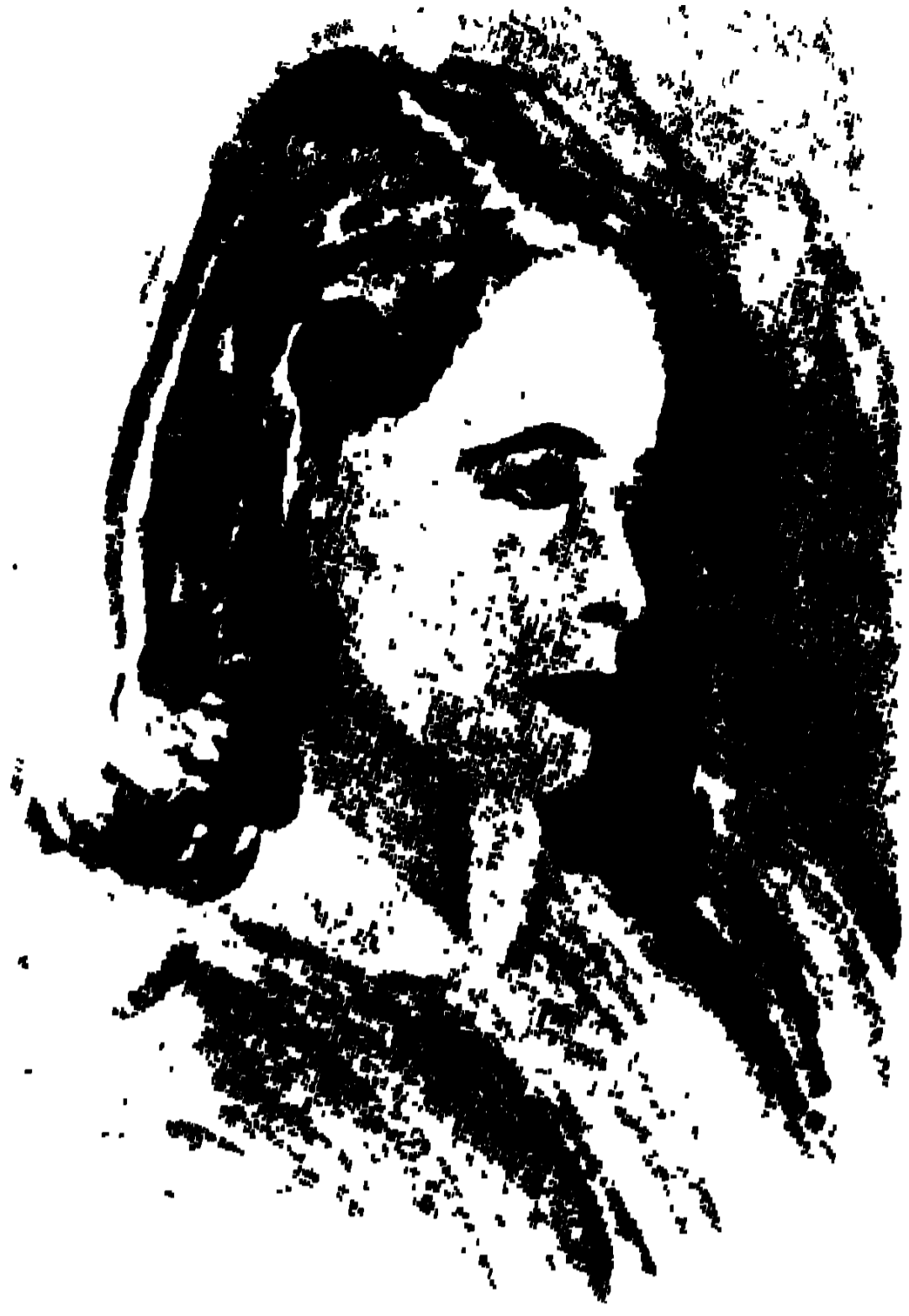
জপবঙে আমার আঁকা উঁনা