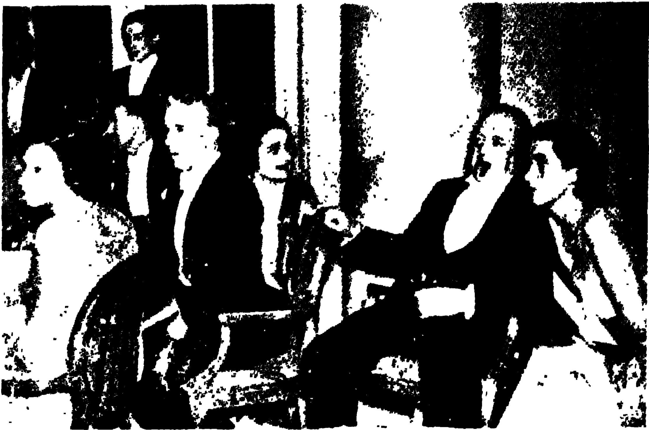
ক্যাথেরিন অসরে উইনস্টন চার্চিলের সাথে