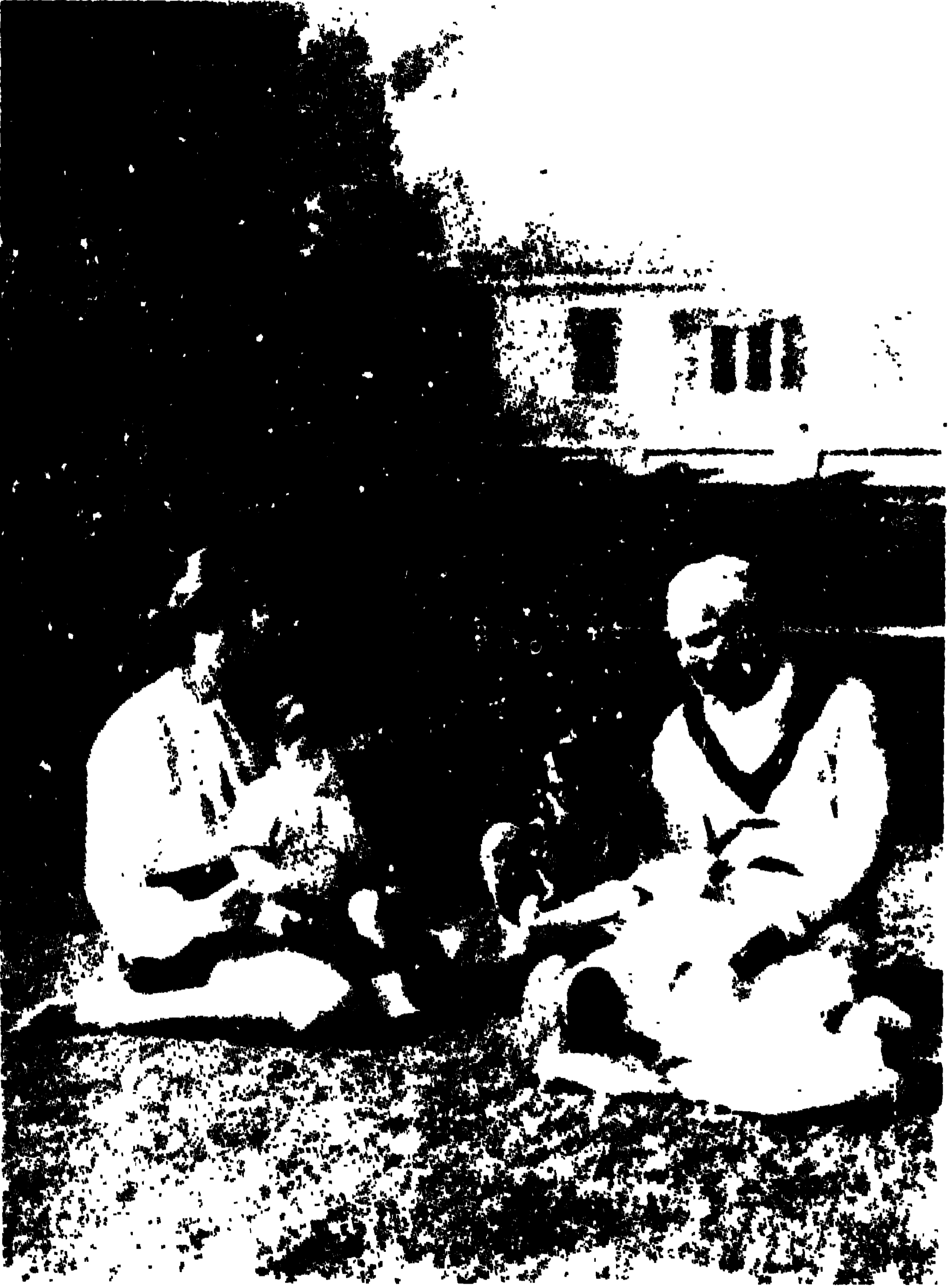
আদি উমা আর দুই নবাগত