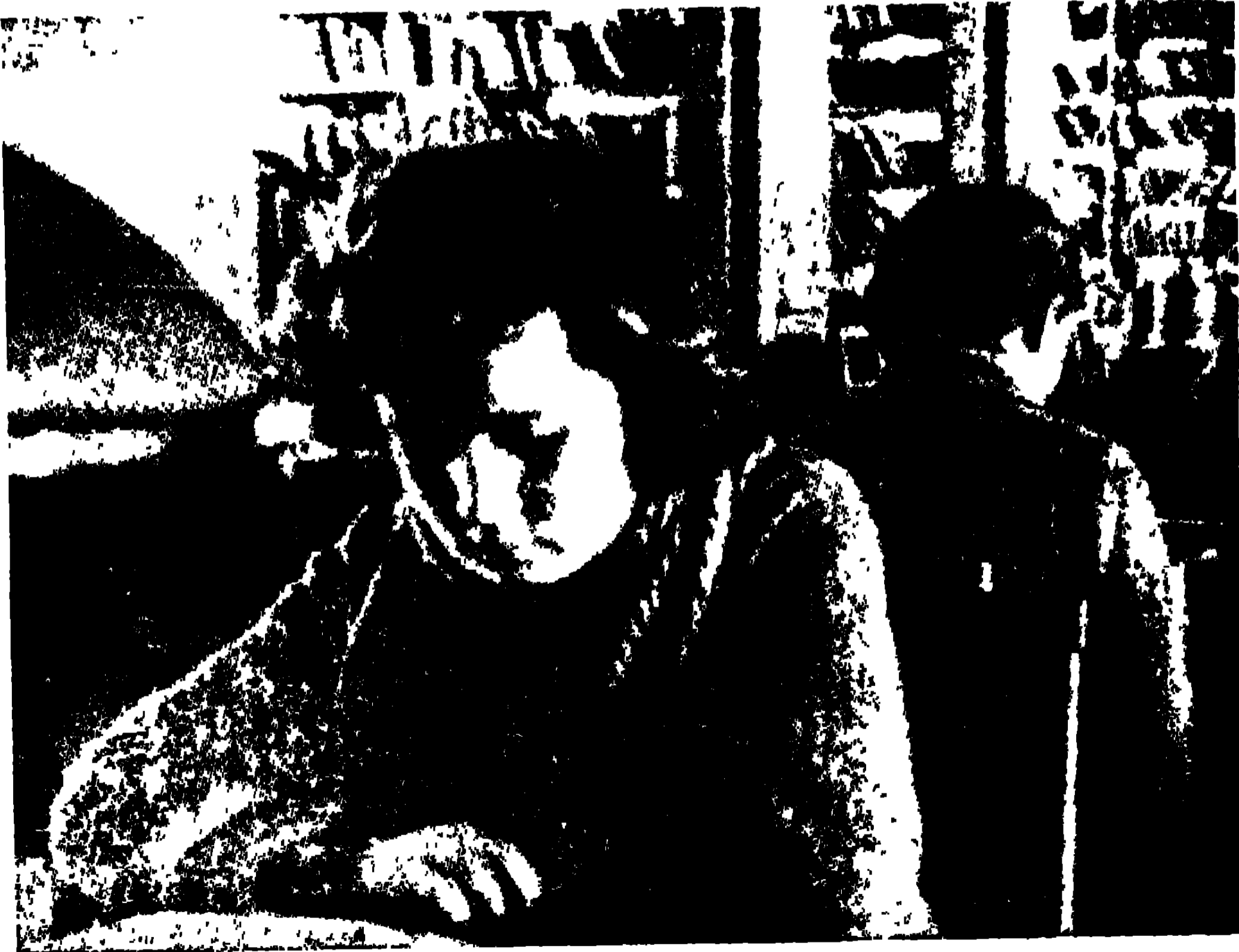
আস্কাবাদের অধ্যয়নয়তা ছাত্রী