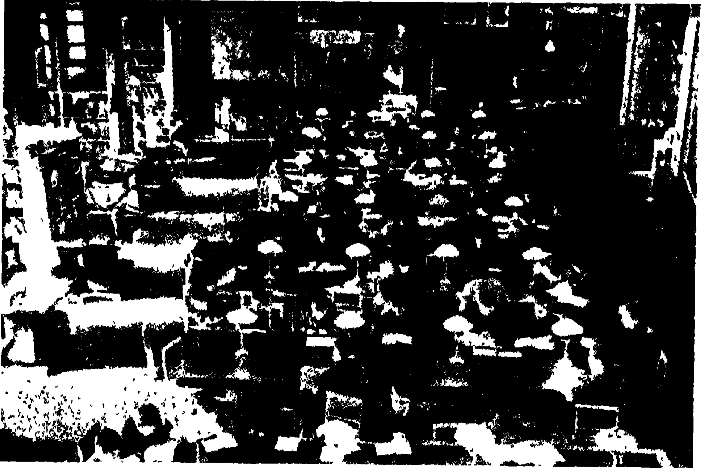
বোথারার লাইব্রেরীর অভ্যন্তর