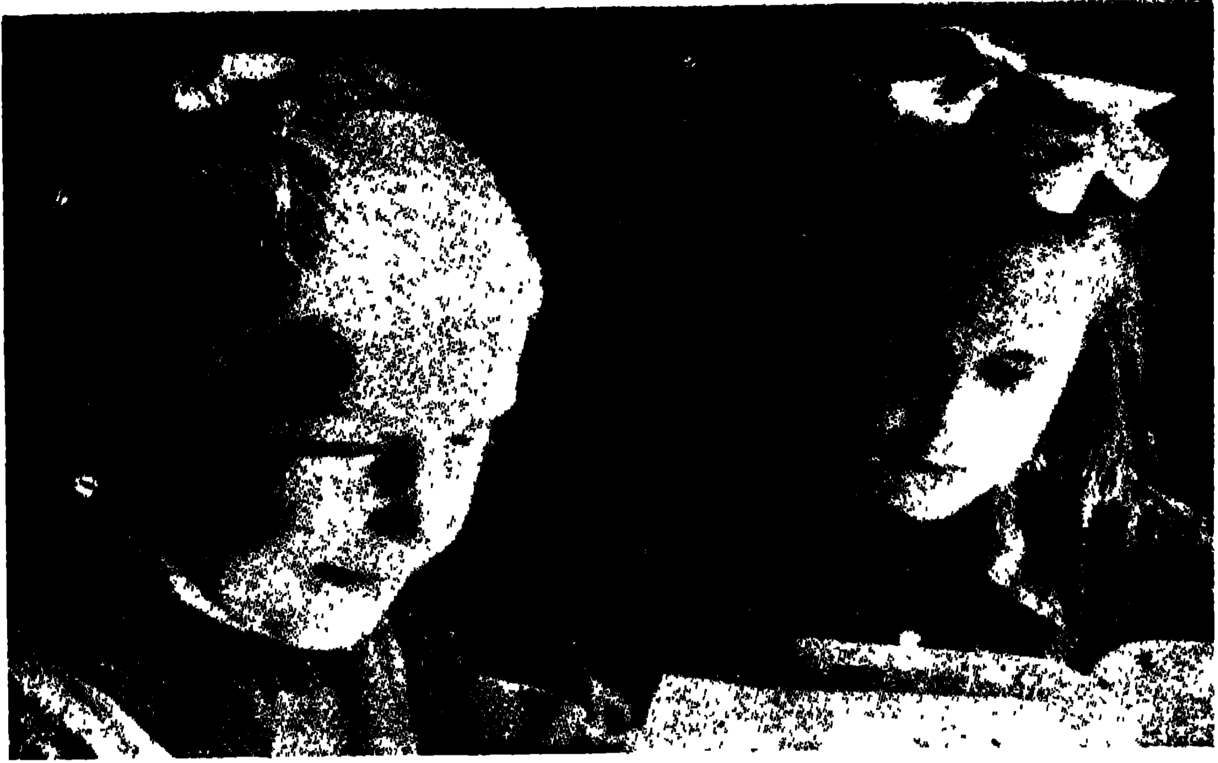
ছ'টি তাজিক শিশু