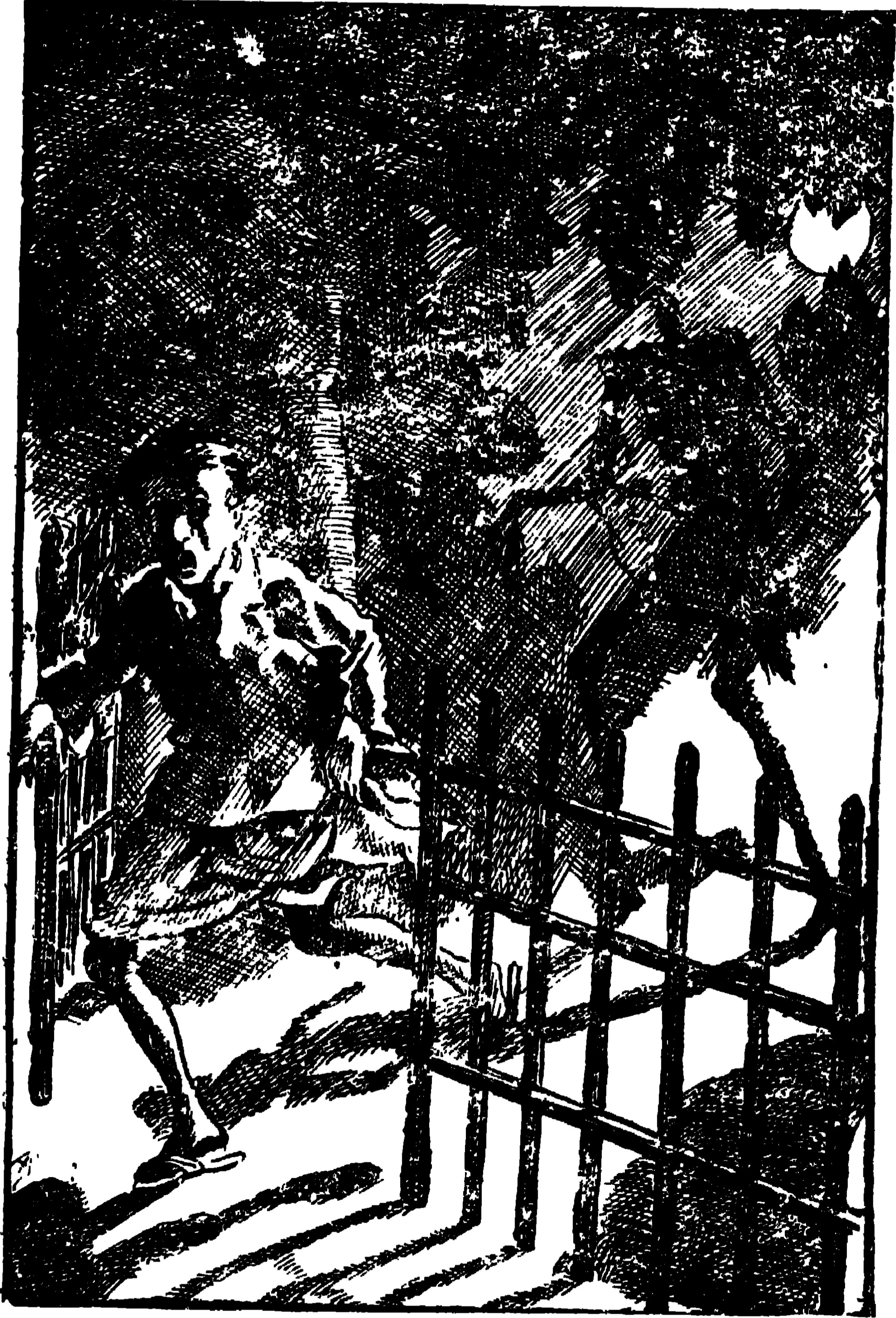
একটানে বাগানের ফটক খুলে দিলীপ আবার ছুটল