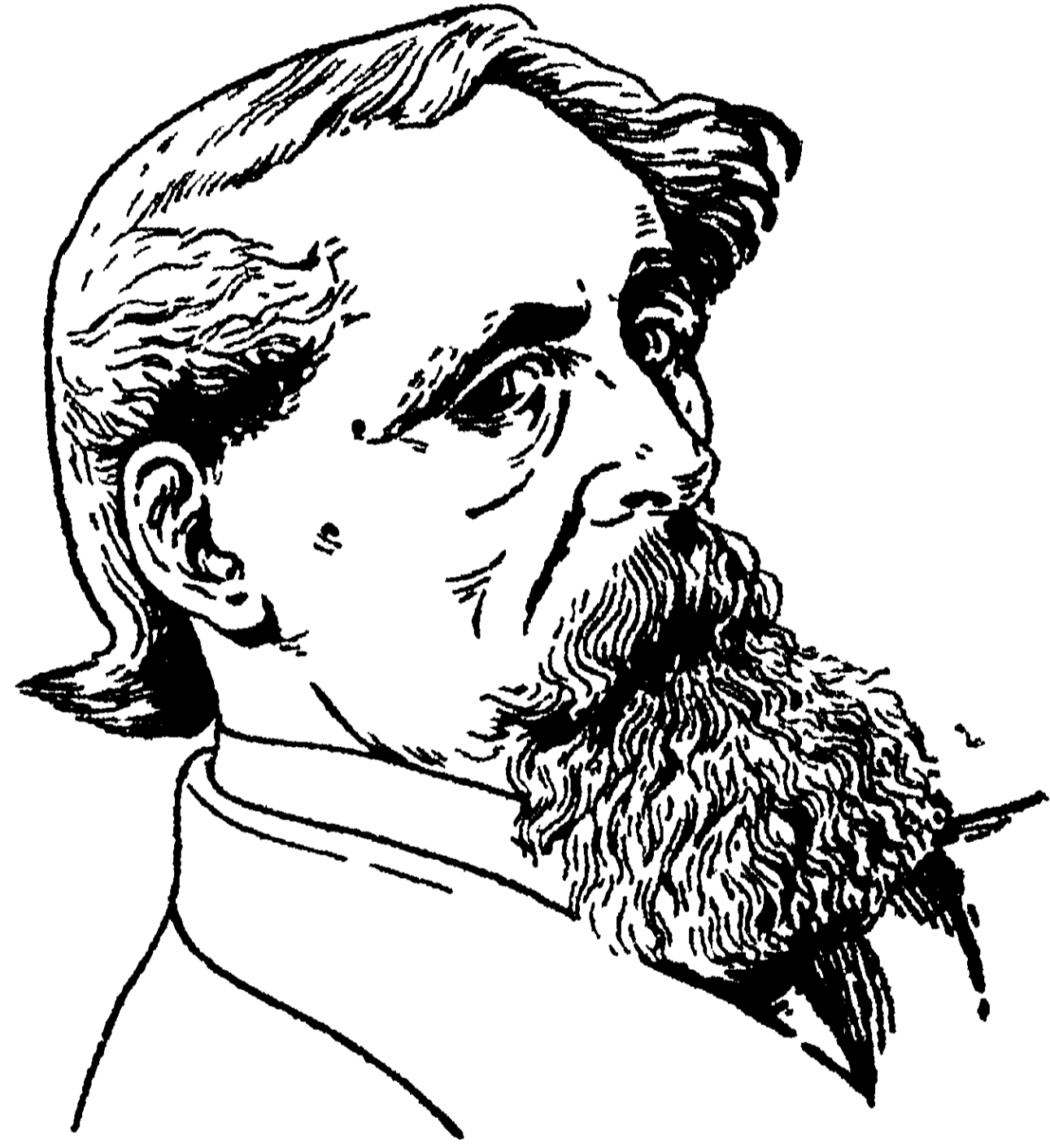
চার্লস্ ডিকেন্স্ ( ১৮১২—১৮৭০ )