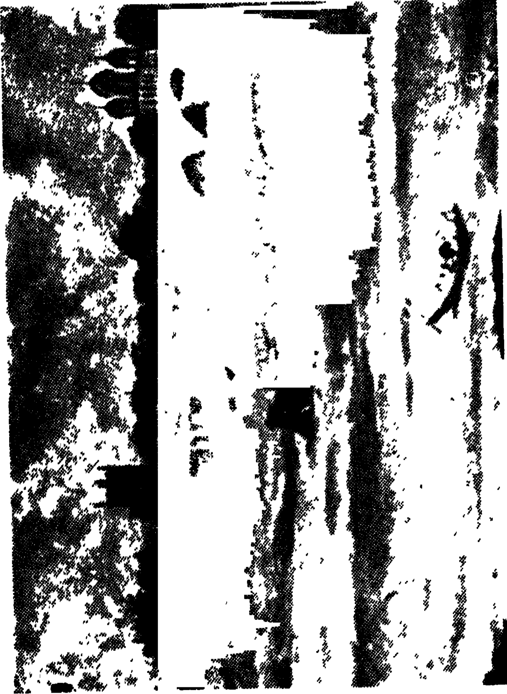
নবদ্বীপের গঙ্গার ঘাট

ভারতের বাহিরের বহু পণ্ডিত এখানে সংস্কৃত শিক্ষা করিতে আসিতেন। এখনও এখানে সরকারী সাহায্য প্রাপ্ত টোল ও সংস্কৃত বিদ্যালয় আছে।