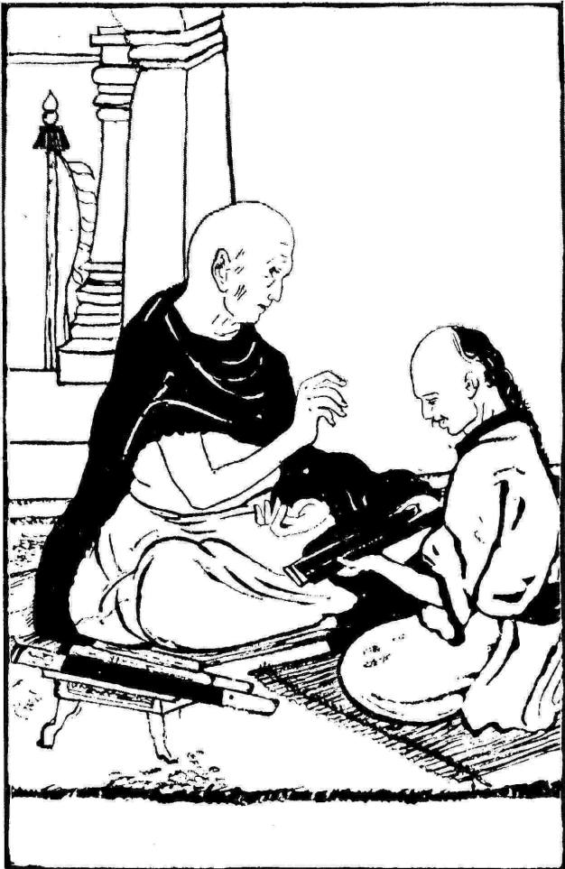
സച്ചാല്യക്ഷൻ ദീപങ്കര ശ്രീജ്ഞാനനം, തിബതൃൻ വിദ്യാത്ഥിയും. (ചിത്രകാരൻ: മണിഭൂഷണഗുപ്ത.)