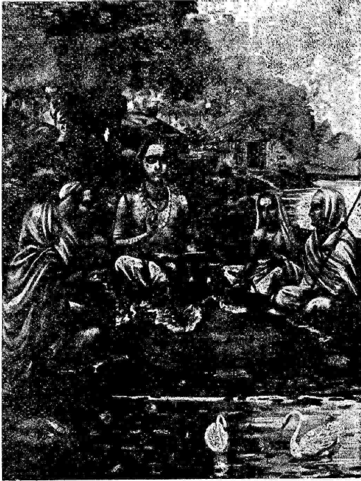
ശ്രീ ശങ്കരാചാര്യൻ ശിഷ്യന്മാരും.