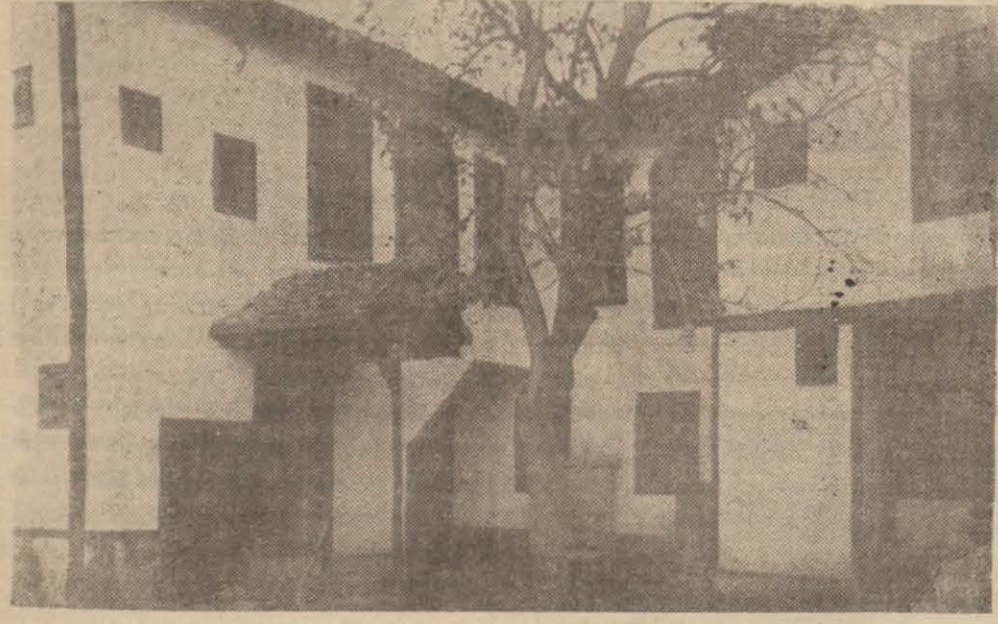
Maarif Cemiyetinin Samanpazarındaki pansiyonu

Ölü olduğu Maarif Vekâletince de tasdik edildi.