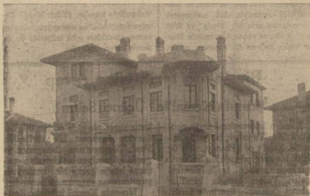
Maarif Cemiyetinin Yenişehir'deki mektebi

İstanbul Talebe Yurdu: Buradaki yurt 1928 yılında kurulmuştur. Yurt 1930 yılında Gazi Hazerleri tarafından ziyaret edilmiştir. Dört yıl zarfında yurttan barınan talebe mevcudu 695 i bulmuştur. 934 yılında yurt tamamen tamir edilmiş eşyaları da yenileştirilmiştir. 104 talebesi vardır.