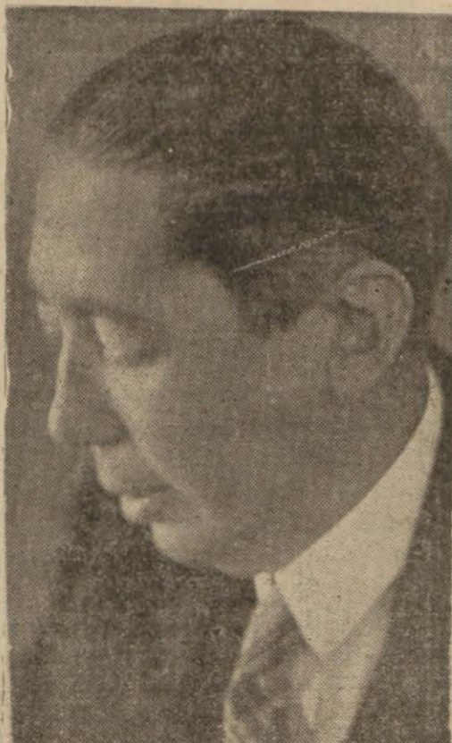
Romanya Hariciye Bakanı M. Titulesko