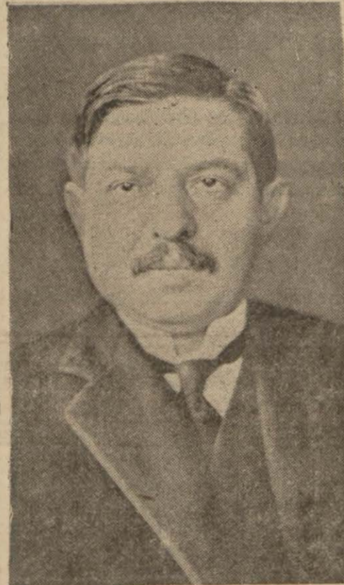
Fransız Hariciye Bakanı M. Laval

Paris, 27 (A.A.) — Dün öğleden son- ra M. Laval ile M. Titulesko arasında yapılan ve çok dostça olduğunu söyle- mek gerek olan görüşme, bir müzake re olmaktan ziyade önceden yapılmış