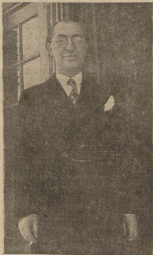
Türkiye Hariciye Bakanı T. R. Aras

Tevfik Rüştü Aras ve M. Titulesko M. Lavalin öğle yemeğinde