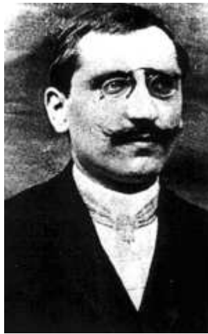
Henri Léon Lebesgue (1875-1941)

Wir haben jetzt alle Hilfsmittel zusammen, um auf den Borel-Mengen des \mathbb{R}^n ein Maß zu definieren, dass für einen Quader, dessen Seiten reelle Intervalle sind, einfach das Produkt der Seitenlängen ist. Dieses Maß heißt Borel-Lebesgue-Maß . Wir beginnen mit der eindimensionalen Situation.