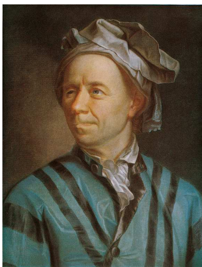
Leonhard Euler (1707-1783)

und konvergieren somit gegen 0. Also liegt insgesamt eine Intervallschachtelung vor. \square