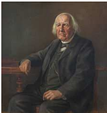
Karl Weierstraß (1815-1897)

Die folgende Aussage heißt Satz von Bolzano-Weierstraß .