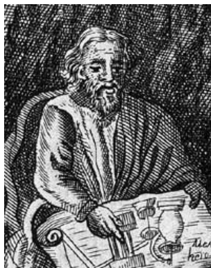
Heron von Alexandria (1. Jahrhundert n.C.)

als nächste Approximation. So fortfahrend erhält man eine immer besser werdende Approximation von \sqrt{5} .