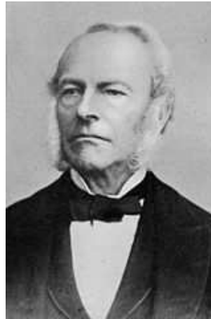
George Stokes (1819 -1903)

Der Satz von Stokes gehört zu den wichtigsten Sätzen der Mathematik. Er stiftet eine direkte Beziehung zwischen dem Integral einer Differentialform über dem Rand einer berandeten Mannigfaltigkeit und dem Integral der äußeren Ableitung dieser Form über der gesamten Mannigfaltigkeit. Damit handelt es sich um eine weitgehende Verallgemeinerung des Hauptsatzes der Infinitesimalrechnung, nach dem das bestimmte Integral einer auf einem Intervall definierten Funktion mittels der Stammfunktion allein durch die Werte am Intervallrand ausgedrückt werden kann.