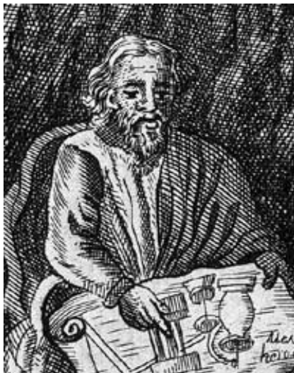
Heron von Alexandria (1. Jahrhundert n.C.)