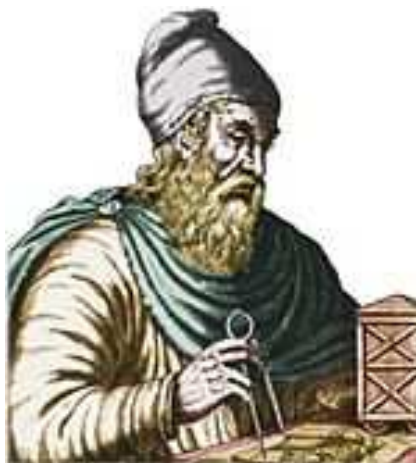
Archimedes (ca. 287 -212 v. C.)

Die ersten beiden Eigenschaften drücken aus, dass auf \mathbb{R} eine totale (oder lineare ) Ordnung vorliegt; die in (2) beschriebene Eigenschaft heißt Transitivität. Die fünfte Eigenschaft heißt Archimedes-Axiom .