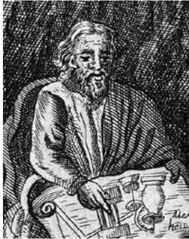
Heron von Alexandria (1. Jahrhundert n.C.)