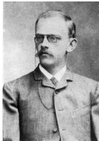
David Hilbert (1862-1943) nannte sie ein Paradies, aus dem die Mathematiker nie mehr vertrieben werden dürfen.

Eine Menge ist eine Ansammlung von wohlunterschiedenen Objekten, die die Elemente der Menge heißen. Mit „wohlunterschieden“ meint man, dass es klar ist, welche Objekte als gleich und welche als verschieden angesehen werden. Die Zugehörigkeit eines Elementes x zu einer Menge M wird durch