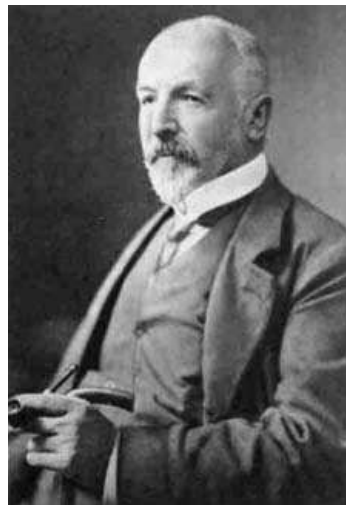
Georg Cantor (1845-1918) ist der Schöpfer der Mengentheorie