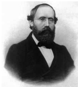
Georg Friedrich Bernhard Riemann (1826-1866)

Die Kugeloberfläche einer Kugel mit Radius r besitzt den Flächeninhalt 4\pi r^2 . Dies ist ein klassisches Resultat, doch wie kann man den Flächeninhalt einer solchen zweidimensionalen Mannigfaltigkeit präzise erfassen? Um die Maß- und Integrationstheorie der vorhergehenden Vorlesungen anwenden zu können, brauchen wir eine 2-Form auf der Fläche. Über den Begriff der Riemannschen Metrik werden wir zeigen, dass es auf Flächen, die im dreidimensionalen euklidischen Raum eingebettet sind, ein natürliches Flächenmaß gibt, mit dem man den Flächeninhalt ausrechnen kann.