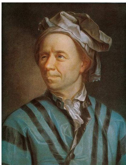
Leonhard Euler (1707-1783)

und konvergieren somit gegen 0. Also liegt insgesamt eine Intervallschachtelung vor. \square