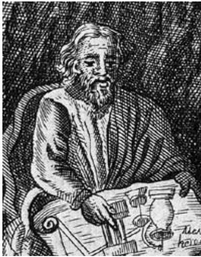
Heron von Alexandria (1. Jahrhundert n.C.)