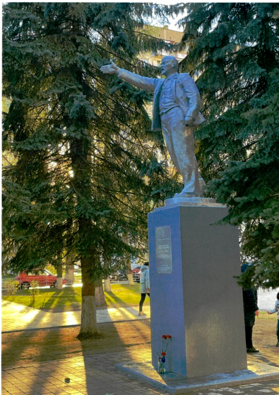
1. Памятник В.И. Ленину, вид с юго-востока

Фотофиксация объекта культурного наследия регионального значения «Памятник В.И. Ленину «Призывающий вождь», 1925, 1940-е гг.»