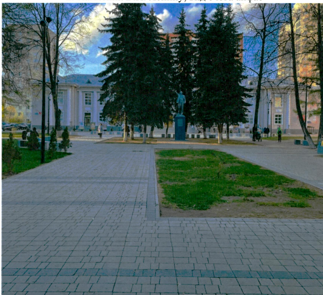
3. Общий Вид с юга