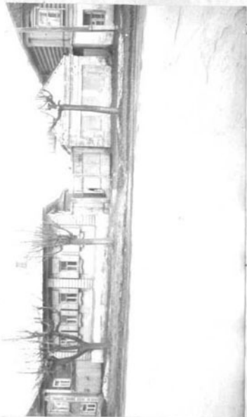
ОЧКА (оборотная сторона)