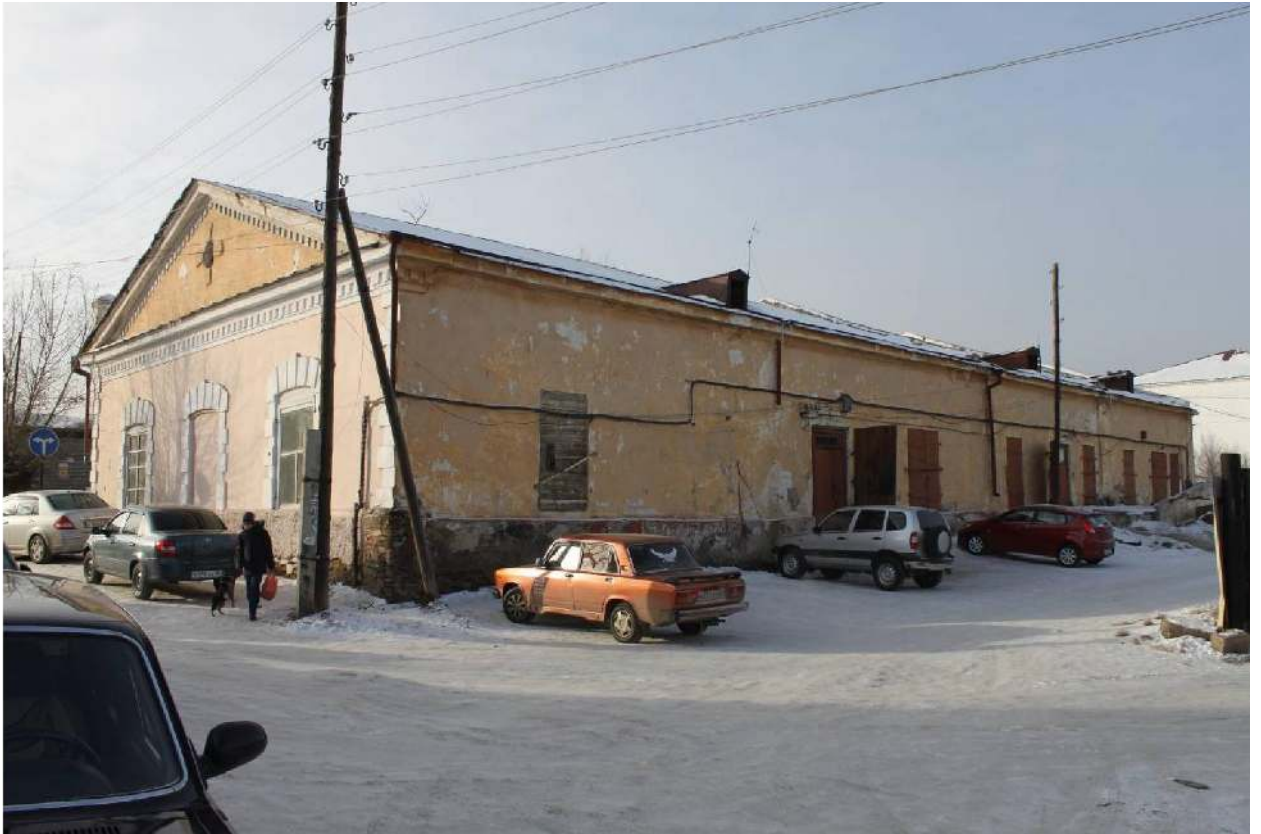
Фото 3. Общий вид с юго-востока.