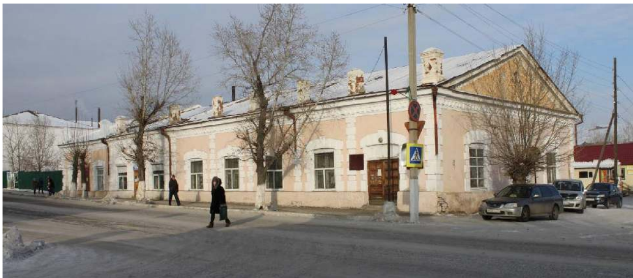
Фото 1. Общий вид с юго-запада.