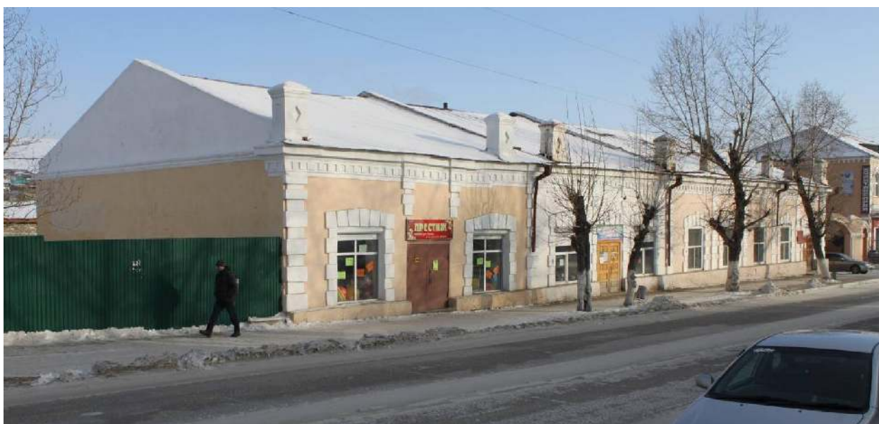
Фото 2. Общий вид с северо-запада.