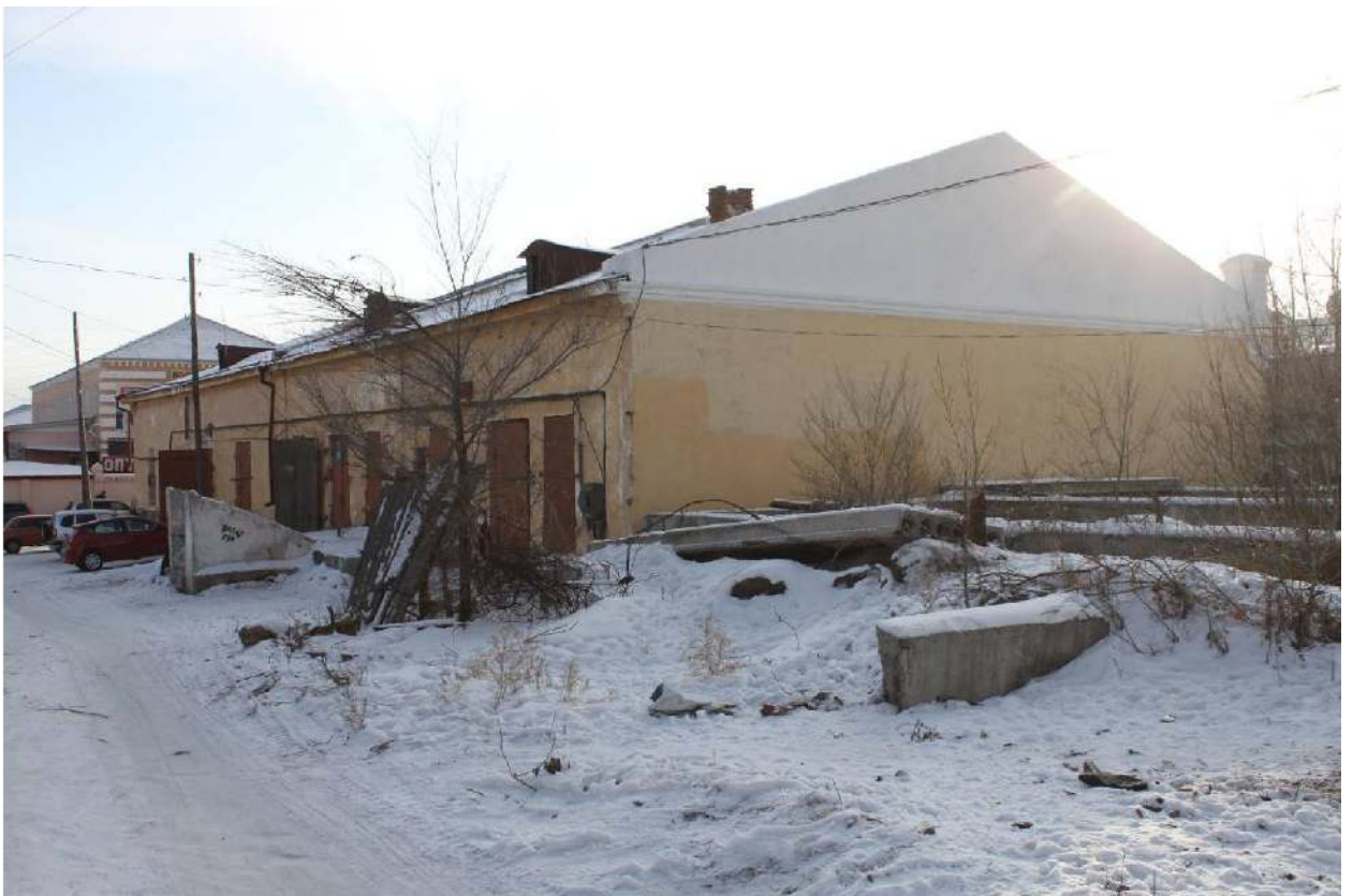
Фото 4. Общий вид с северо-востока.