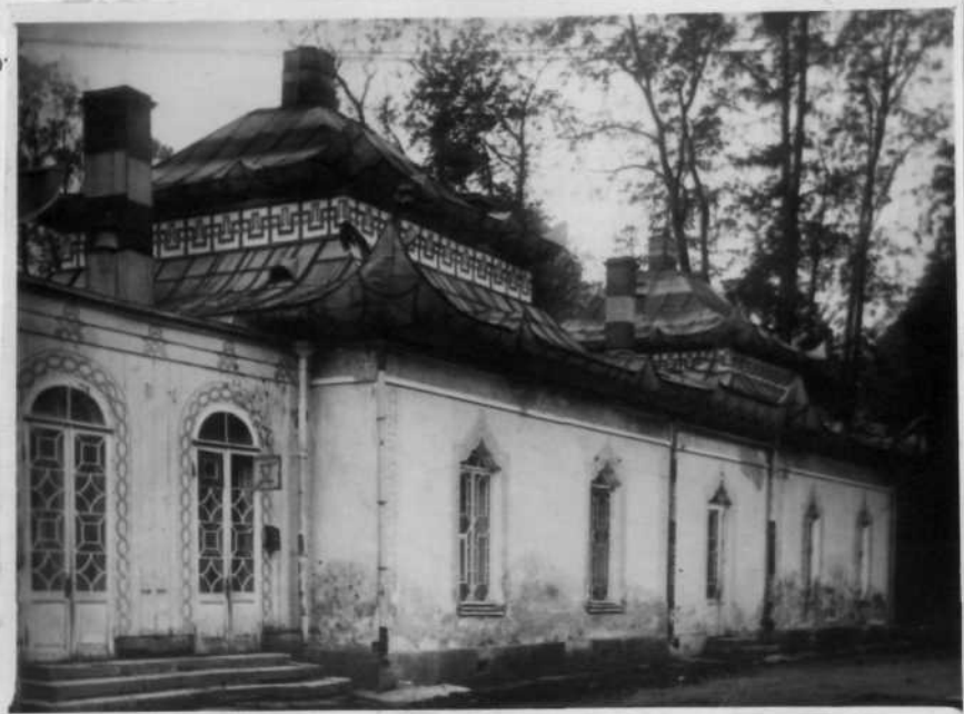
Один из корпусов Китайской деревни до разрушения.