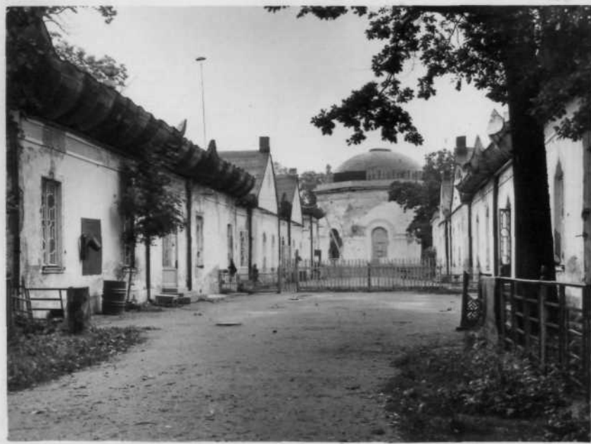
Общий вид /современный/