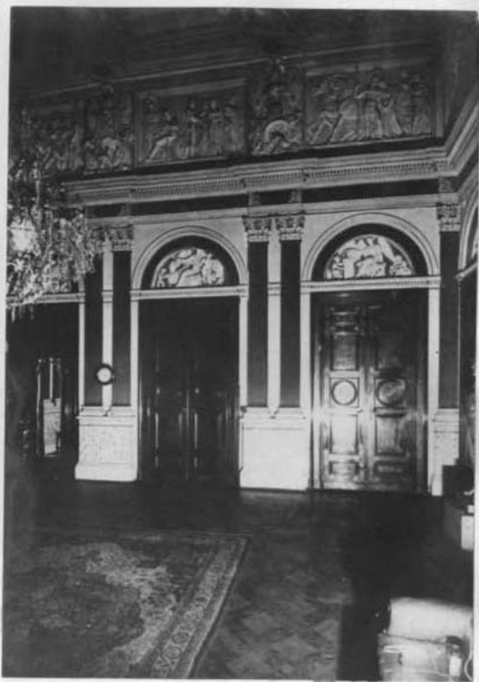
Бывший приемный зал.