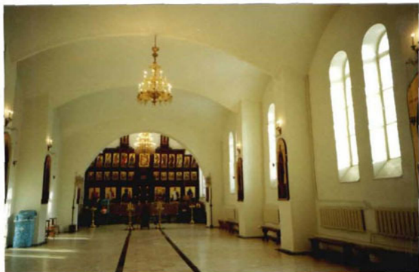
Интерьер церкви Сергия Радонежского