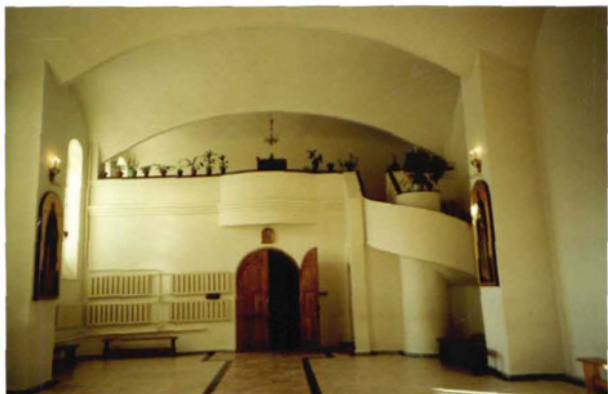
Хоры церкви Сергия Радонежского