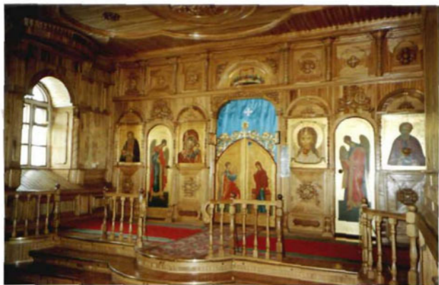
Интерьер Казанской церкви