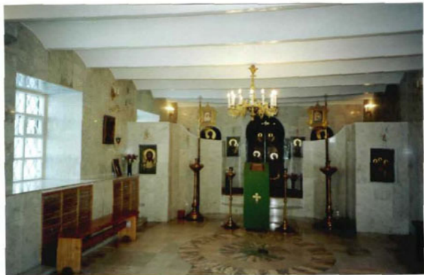
Интерьер церкви Серафима Саравского