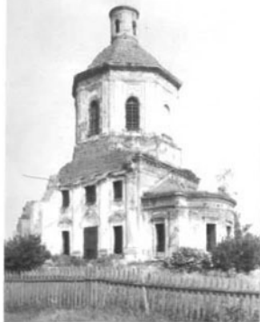
КАРТОЧКА (оборотная сторона)