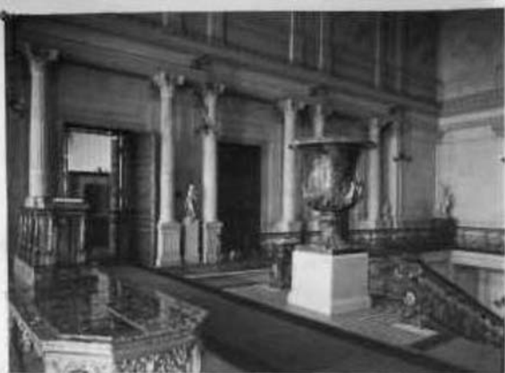
Верхняя палата советской палаты.