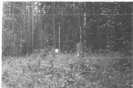
Фото или схематический план