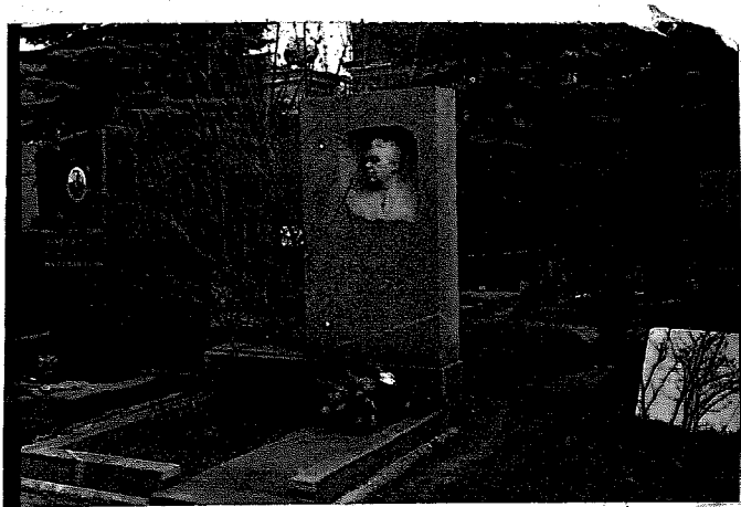
Фото М. Коробейникова, май 1976.