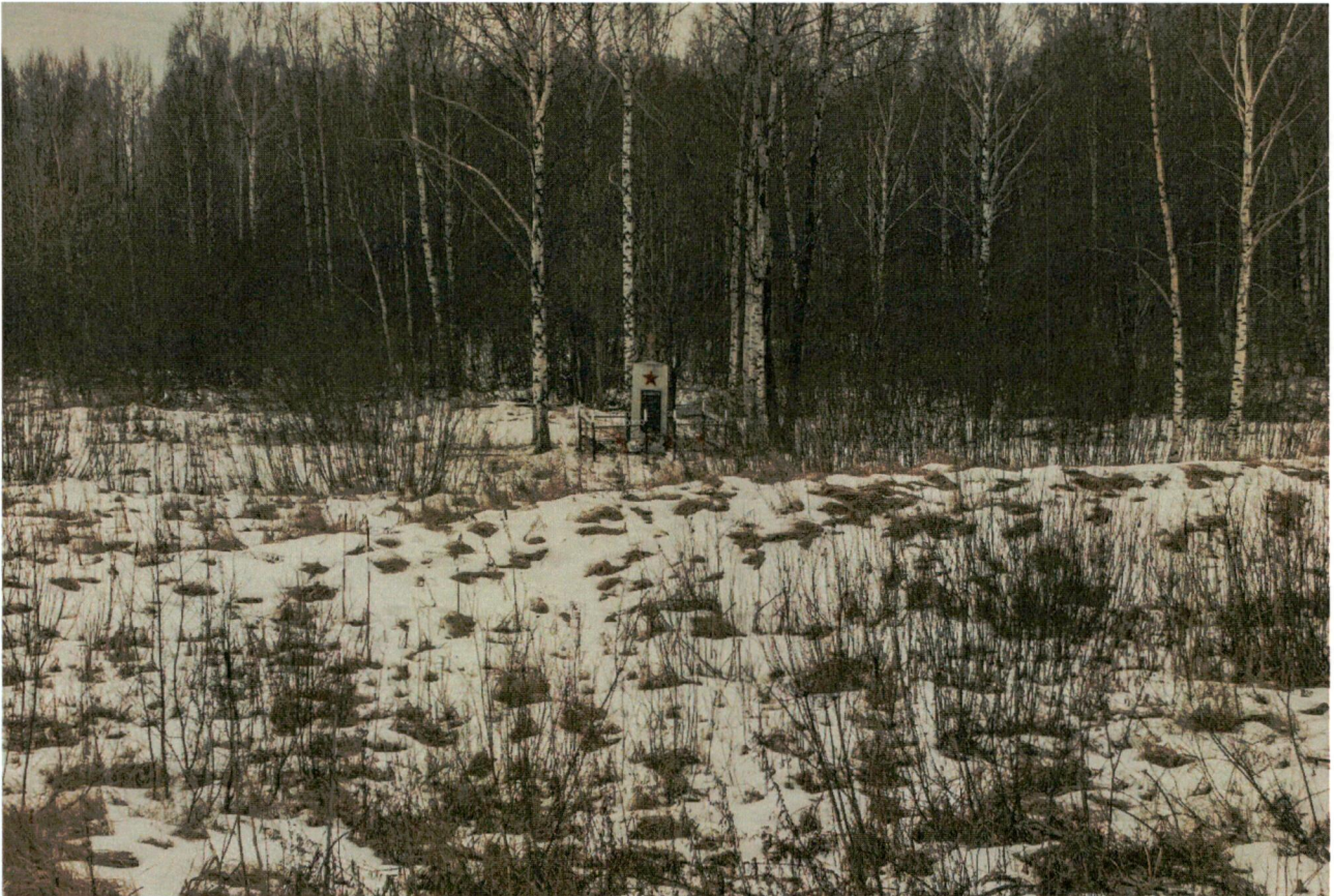
5. Визуальное раскрытие вид в сторону объекта от железной дороги.