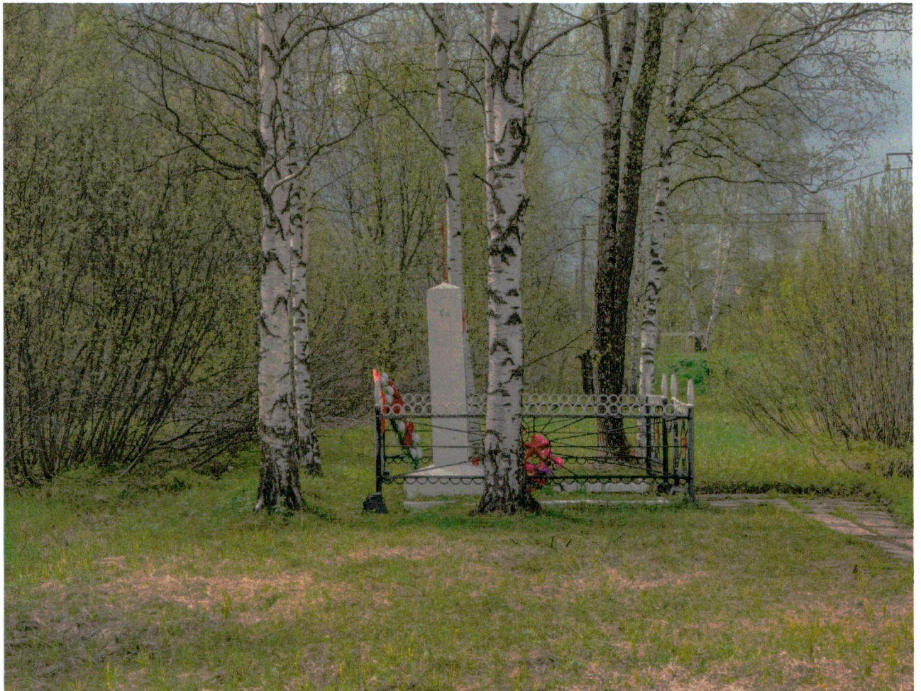
3. Братская могила в окружении насаждений берёзы.