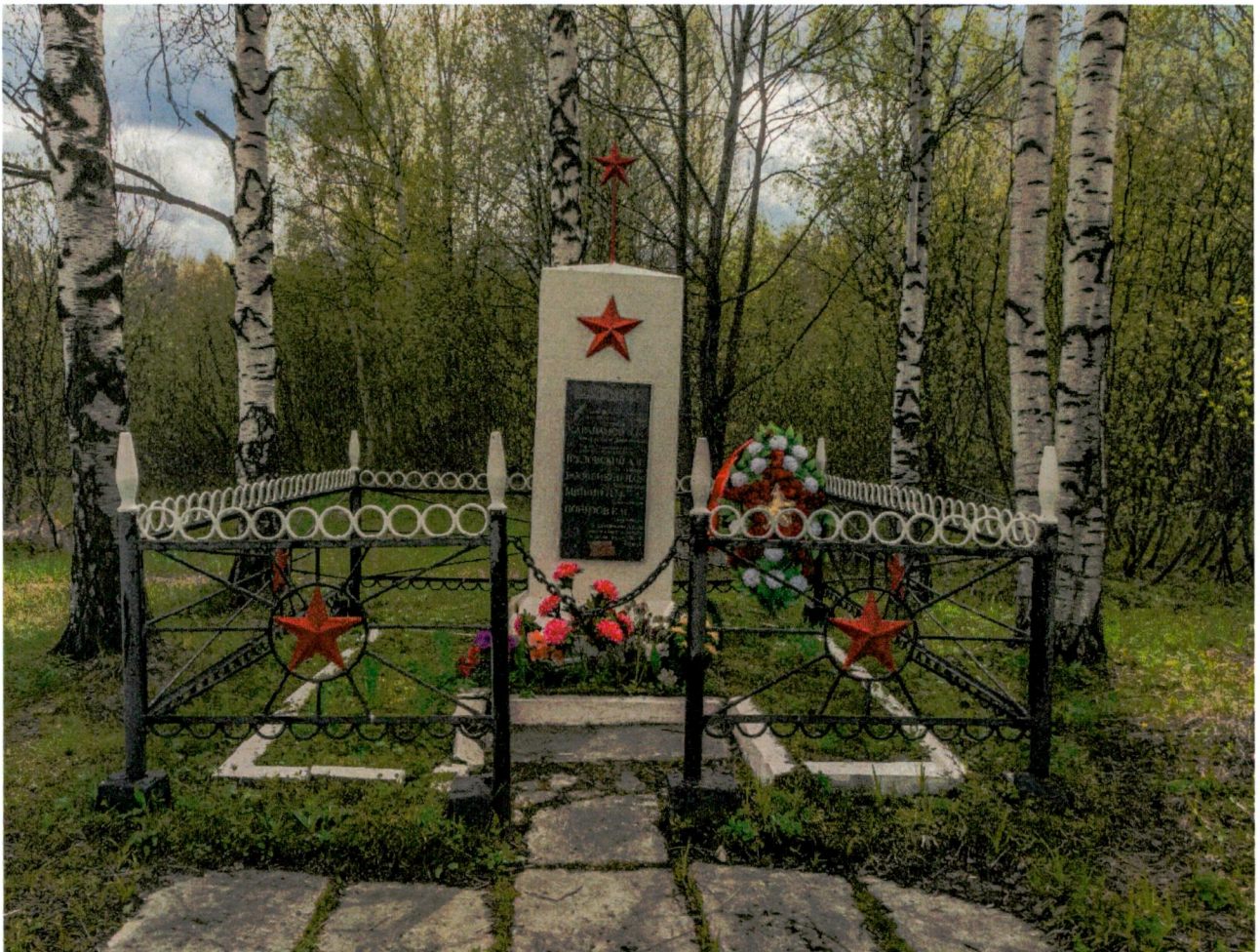
1. Вид на объект вблизи с севера на юг.

Фотофиксация объекта культурного наследия регионального значения «Братская могила павших воинов 1-го бронепоезда 21-го дивизиона бронепоездов у платформы Лесодолгоруково, 1941 г.»