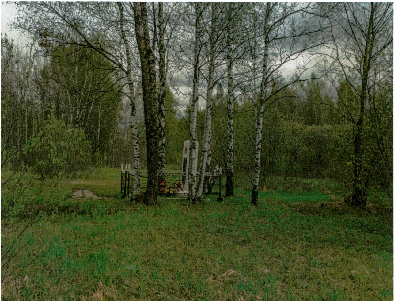
2. Вид на объект вблизи по направлению с востока на запад.