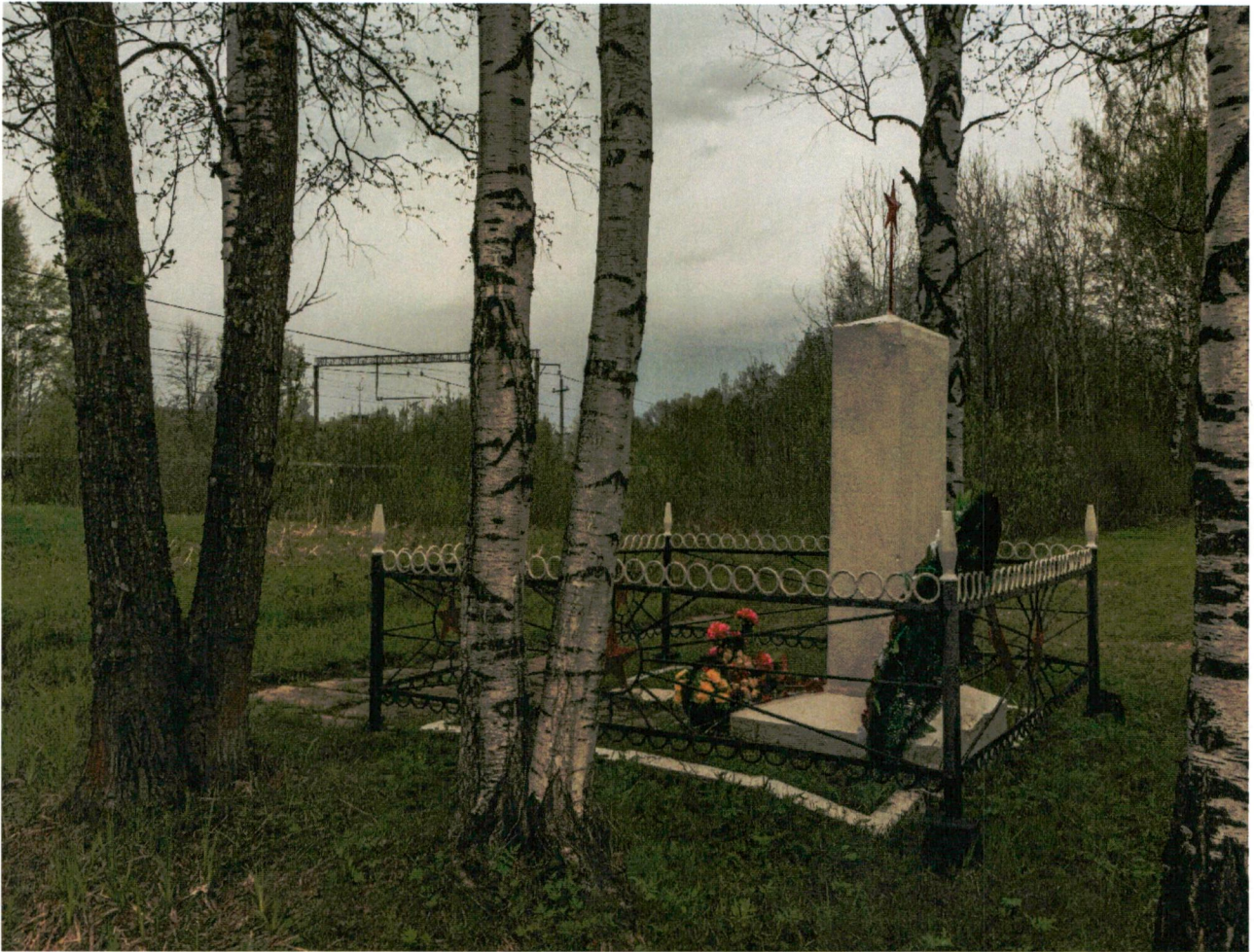
4. Визуальное раскрытие вид в сторону железной дороги от объекта.