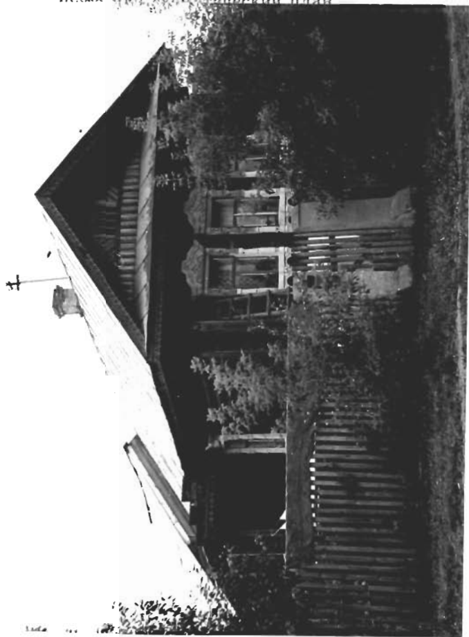
Фото историко-архитектурный план