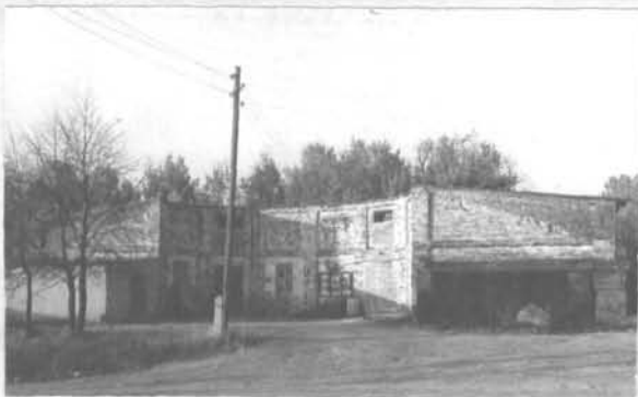
Фото или схематический план