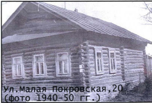
Ул. Малая Покровская, 20 (фото 1940-50 гг.)