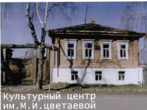
Культурный центр им. М. И. Цветаевой