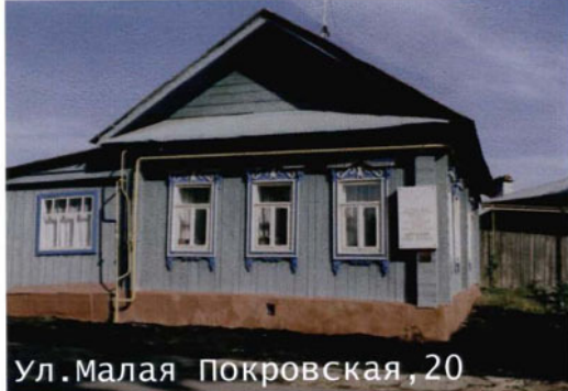
Ул. Малая Покровская, 20