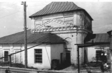
А (оборотная сторона)