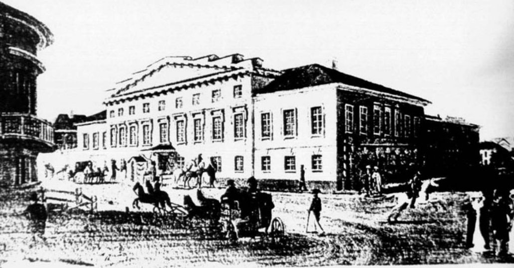
дмъ Казанскаго военнаго Губернатора на Воскресенской улицѣ въ началѣ XIX сто