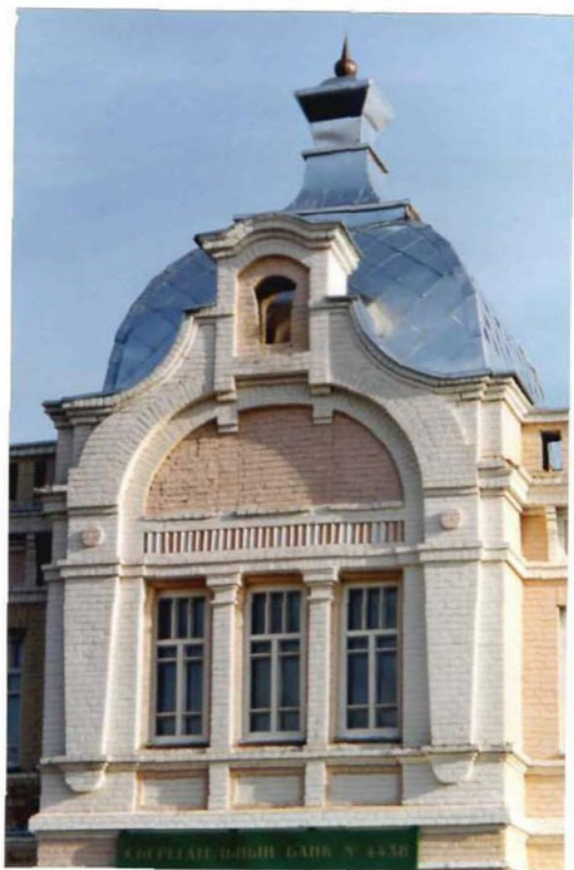
Фрагмент главного фасада