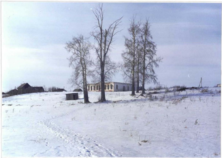
Фото 2. Внешний вид дома со стороны юго-восточного угла.