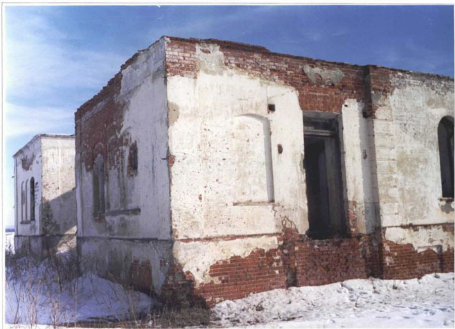
Фото 12. Фрагмент западного фасада.

Чувашская республика, Алатырский р-н, деревня Ялушево. Дом жилой. Конец XIX века