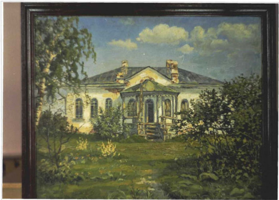
Фото 1. Барская усадьба. Картина художника В. Мичурина. 1927 г.

Чувашская республика, Алатырский р-н, деревня Ялушево. Дом жилой. Конец XIX века