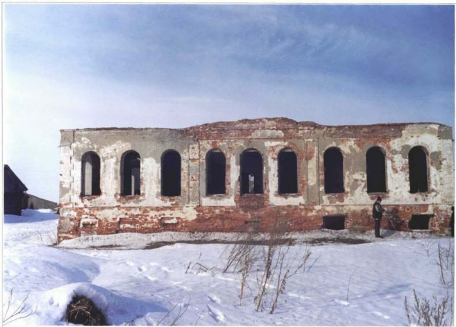
Фото 4. Фрагмент главного фасада.

Чувашская республика, Алатырский р-н, деревня Ялушево. Дом жилой. Конец XIX века