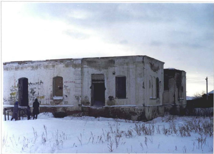
Фото 7. Фрагмент восточного фасада.