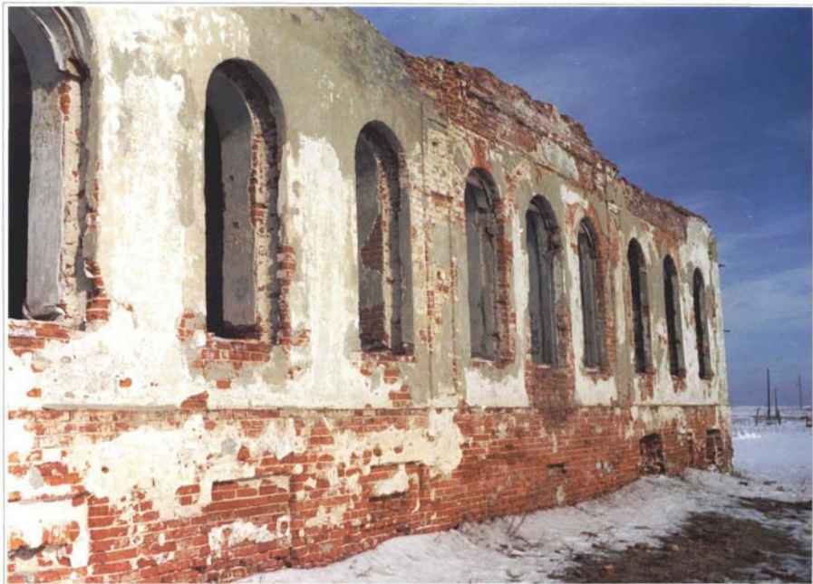
Фото 5. Фрагмент главного фасада.