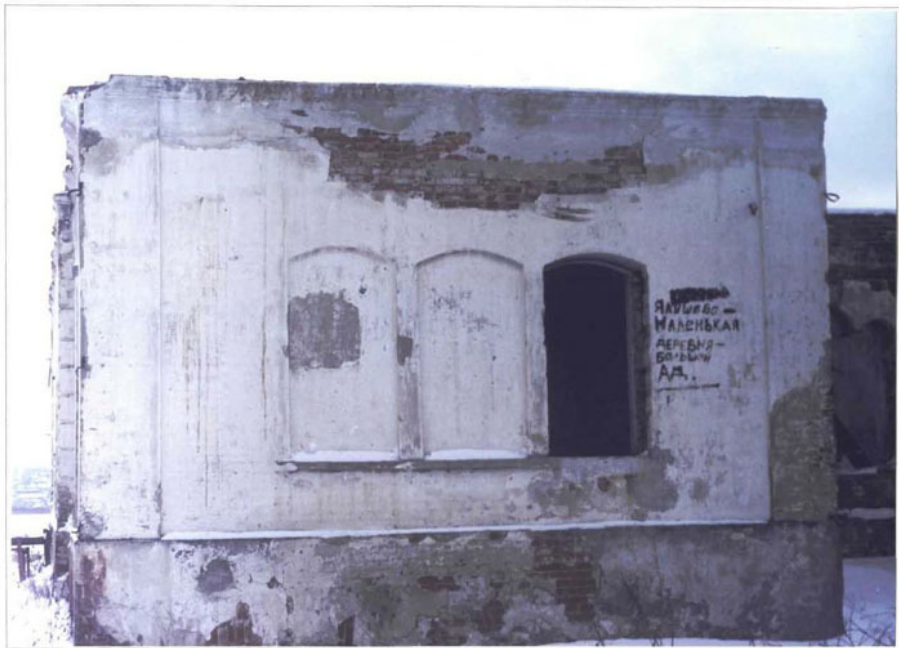
Фото 9. Фрагмент дворового фасада.

Чувашская республика, Алатырский р-н, деревня Ялушево. Дом жилой. Конец XIX века