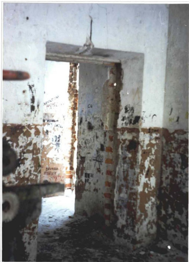
Фото 14. Холл и прихожая.