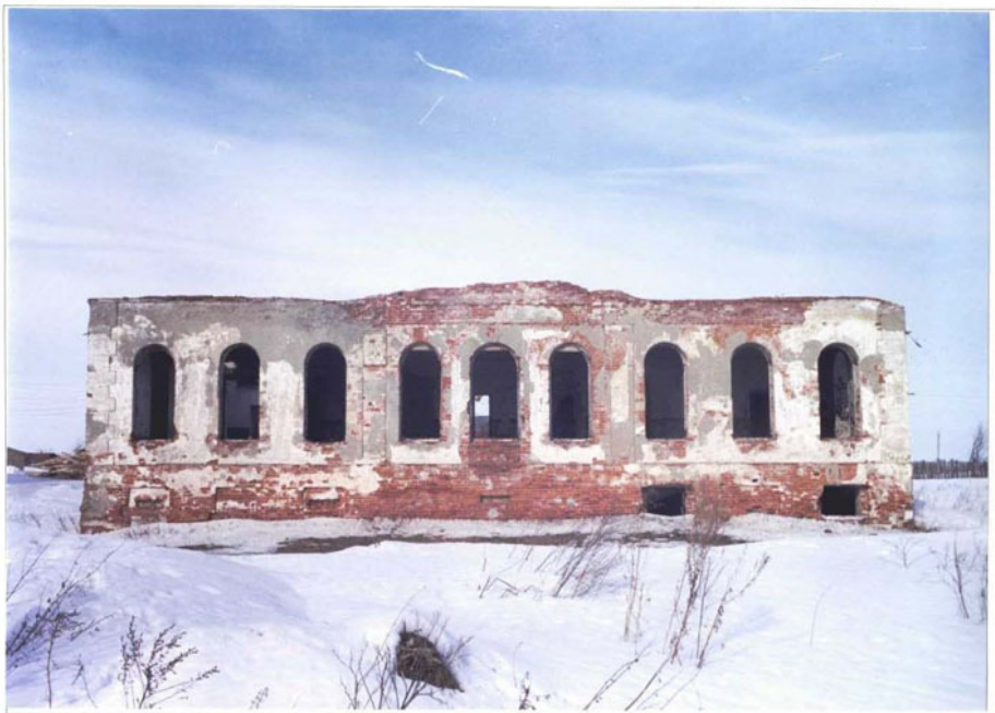
Фото 3. Главный (южный) фасад.

Чувашская республика, Алатырский р-н, деревня Ялушево. Дом жилой. Конец XIX века