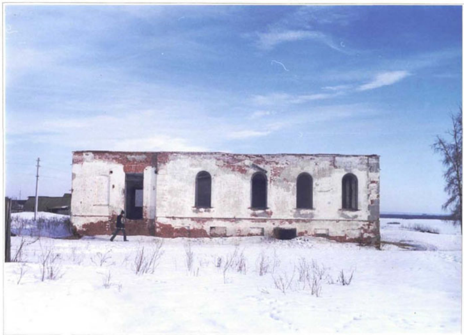
Фото 11. Торцовый (западный) фасад.

Чувашская республика, Алатырский р-н, деревня Ялушево. Дом жилой. Конец XIX века