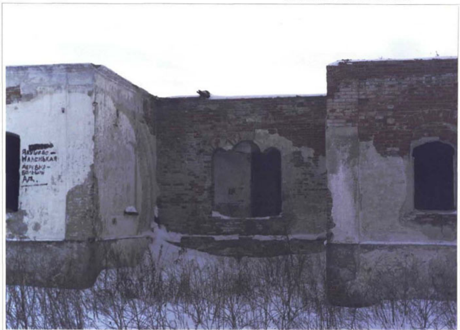
Фото 10. Фрагмент дворового фасада.