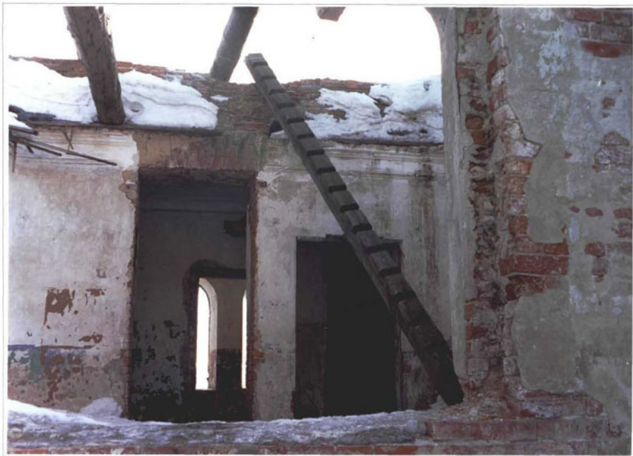
Фото 16. Столовая. 14 января 2000 г.

Чувашская республика, Алатырский р-н, деревня Ялушево. Дом жилой. Конец XIX века