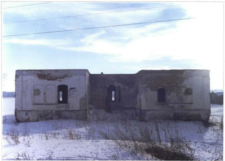
Фото 8. Дворовый (северный) фасад.