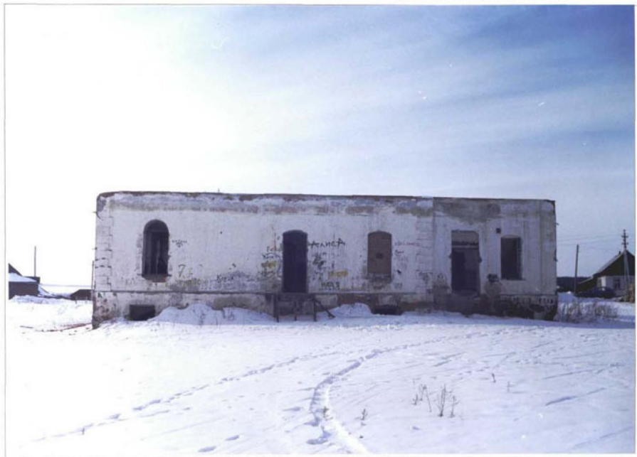
Фото 6. Торцовый (восточный) фасад.

Чувашская республика, Алатырский р-н, деревня Ялушево. Дом жилой. Конец XIX века