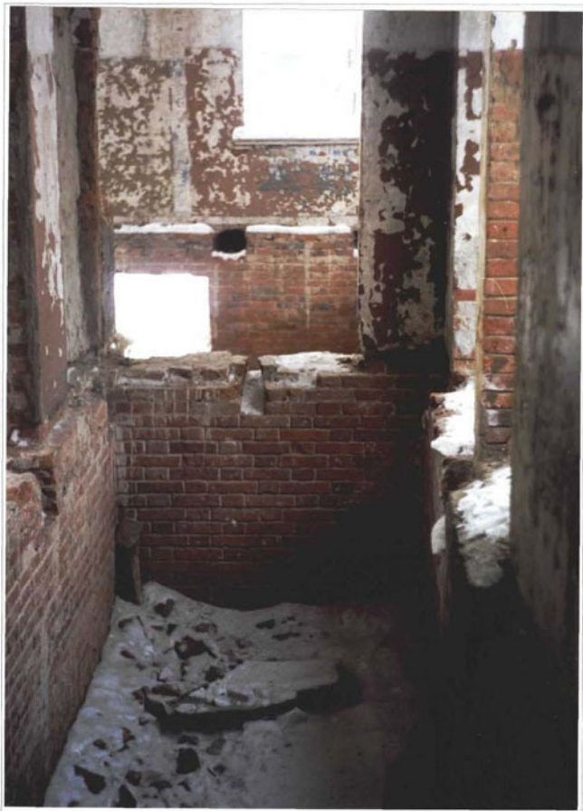
Фото 13. Коридор и гостиная.

Чувашская республика, Алатырский р-н, деревня Ялушево. Дом жилой. Конец XIX века