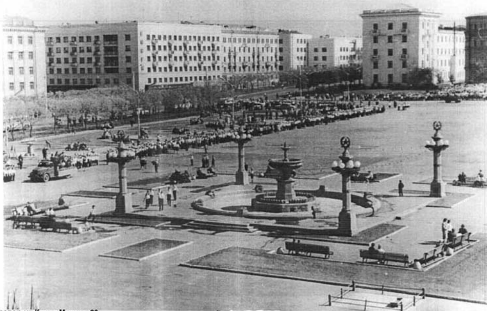
г.Хабаровск, ул.Карла Маркса, 60 Комплекс площади им.В.И.Ленина Общежитие медицинского института, 1952г., 1956г.