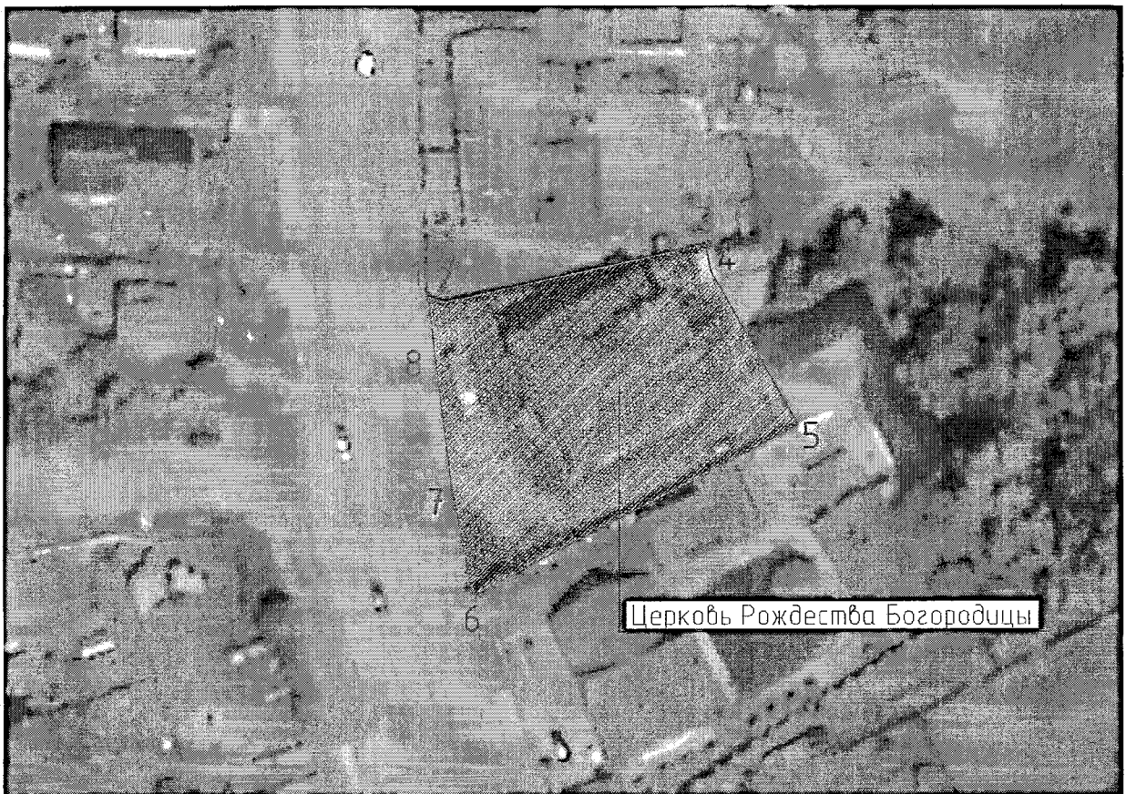
Схема границ территории объекта культурного наследия регионального значения «Церковь Рождества Богородицы, нач. XX в.», расположенного по адресу: Тверская область, Калининский район, Никулинское сельское поселение, деревня Лебедево