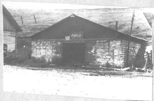
Фото или схематический план